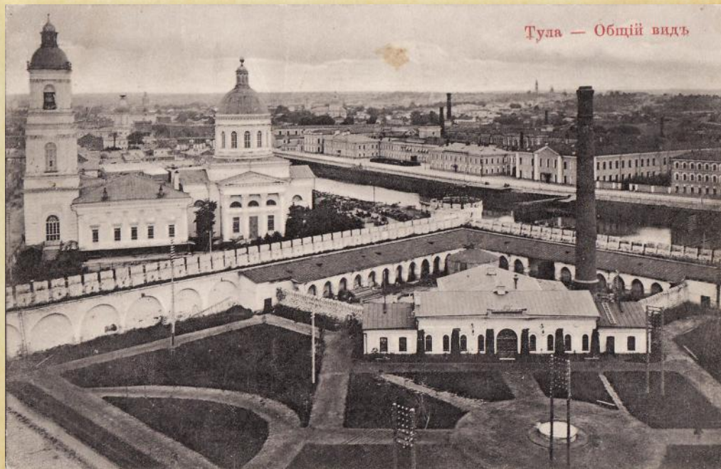
Тула — Общій видъ

992 Длѣто . ѡф . Ходарю до имерва сѣдѣавѡ вѣло Кралои рѣ и рѣ вѣло до вѣло до имероу и а о елла по вѣло вѣло рѣ и а о вѣло вѣло вѣло и ишо до имеръ и а рѣ вѣло и ишо вѣло вѣло и ишо вѣло вѣло вѣло вѣло вѣло вѣло вѣло и ишо вѣло вѣло вѣло вѣло вѣло вѣло вѣло и ишо вѣло вѣло вѣло вѣло вѣло вѣло вѣло и ишо вѣло вѣло вѣло вѣло вѣло вѣло вѣло