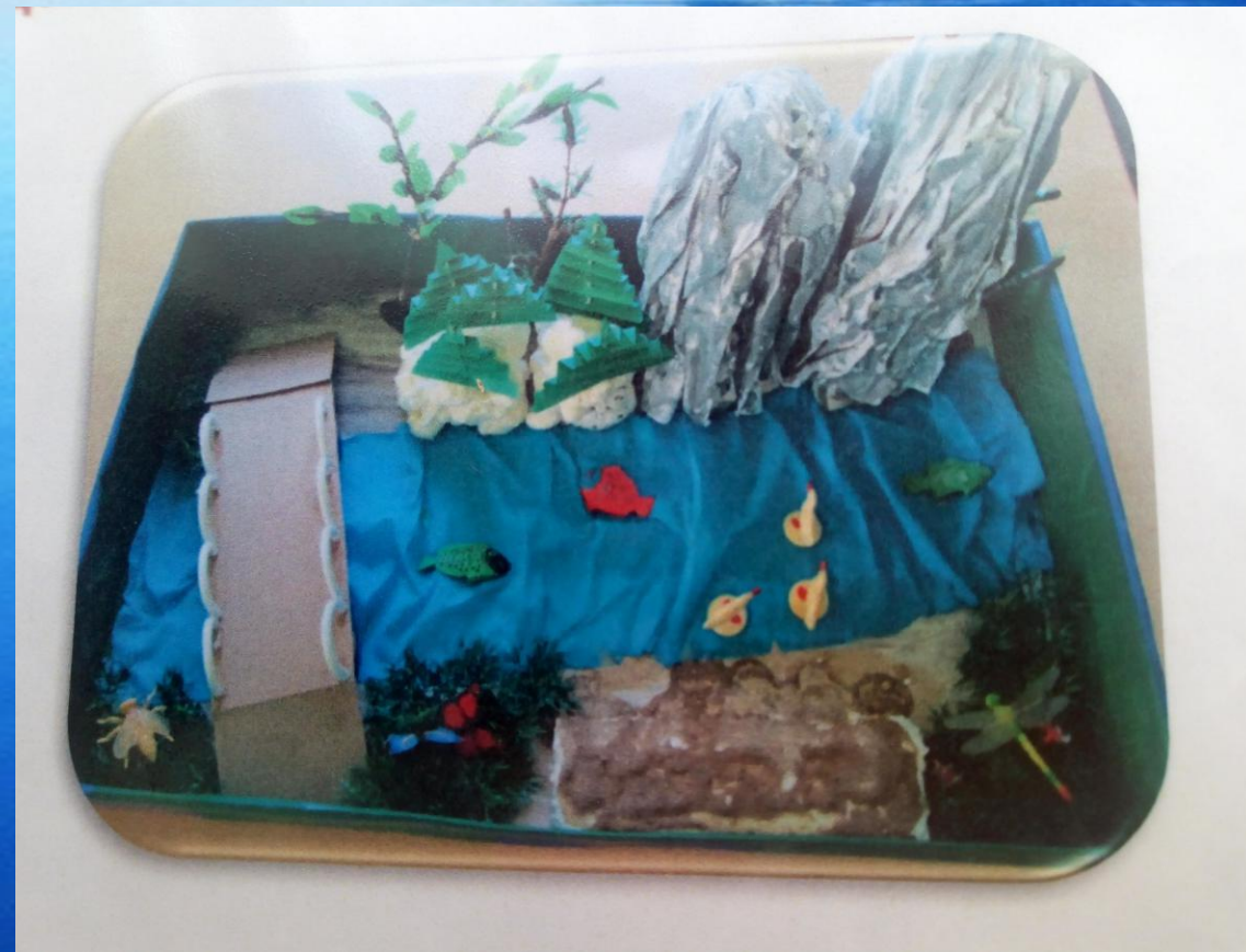
Макет по рассказу Н.А Рыжовой «Как люди речку обидели»