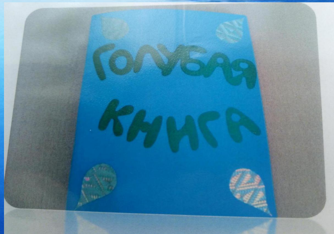
Голубая книга Урала