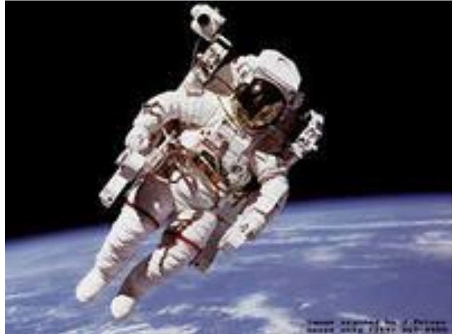
only filter out-1980