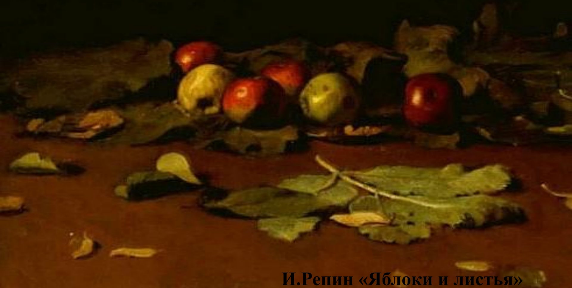
И.Репин «Яблоки и листья»