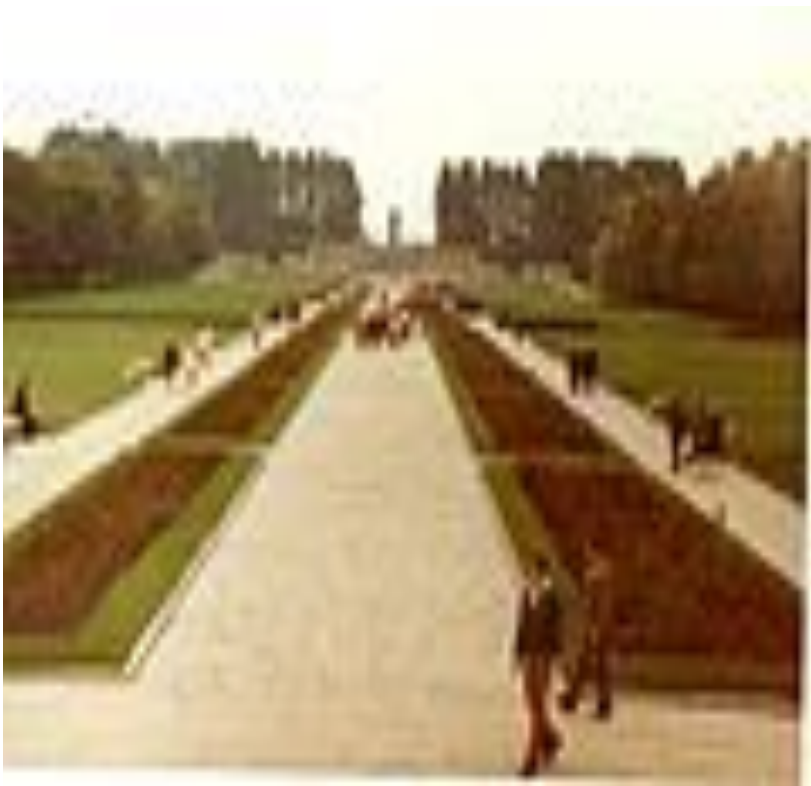
Пискаре́вское мемориальное кладбище