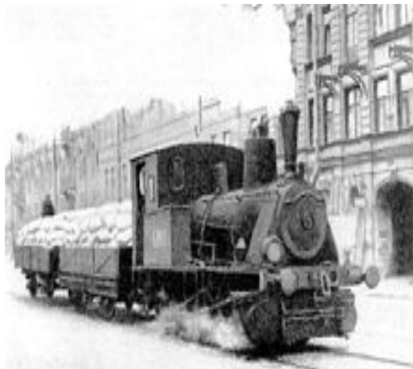
Паровоз везёт муку по трамвайным рельсам в блокадном Ленинграде, 1942 год