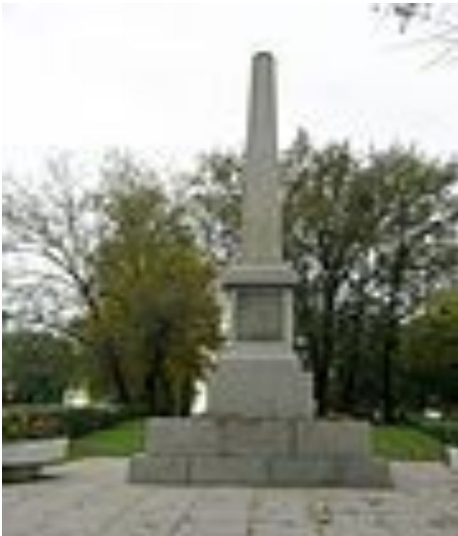
Обелиск защитникам Ленинграда (угол пр. Стачек и пр. Маршала Жукова).