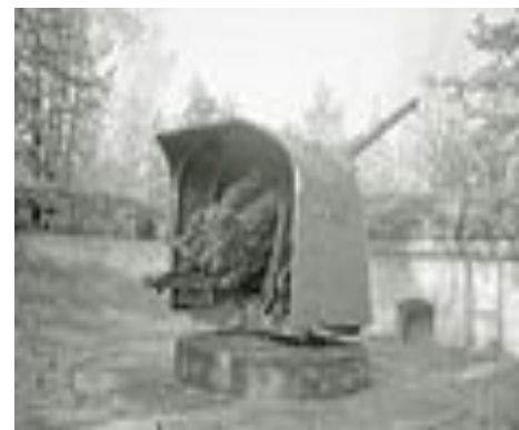
130-мм корабельная пушка образца 1935 года (Б-13)