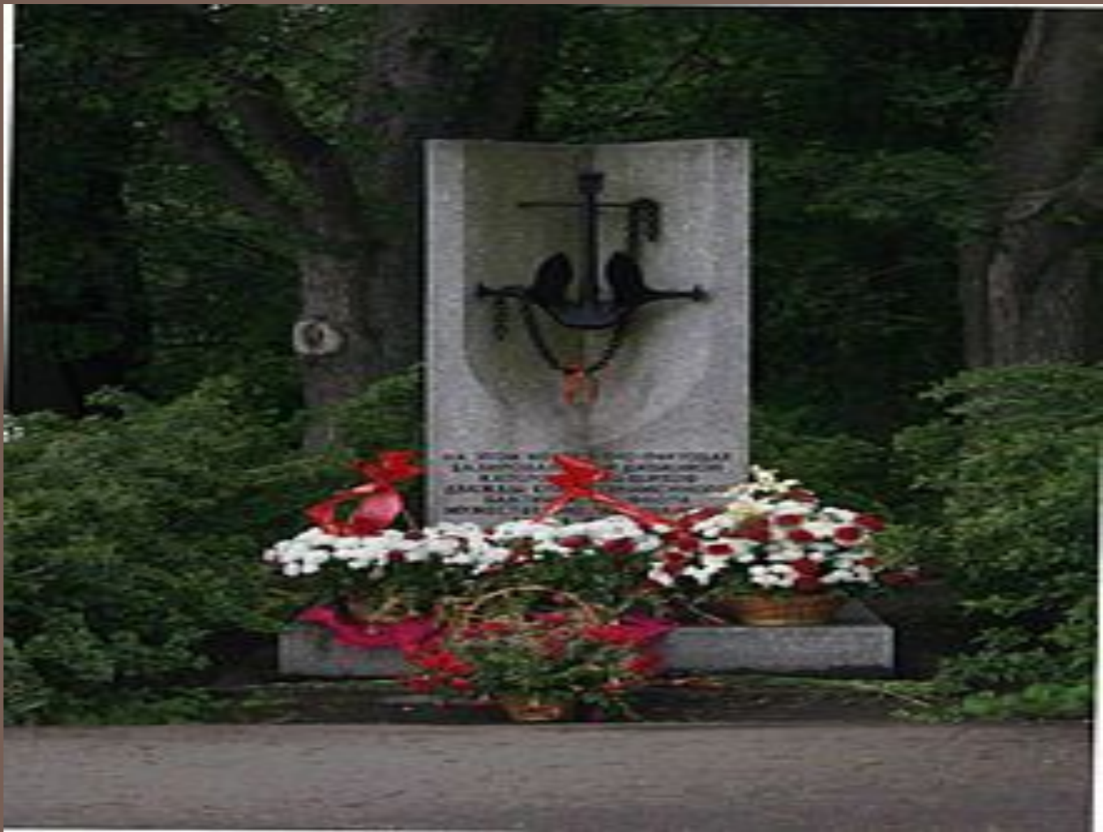
Стела и мемориальная доска памяти морякам катерным тральщикам на Елагином острове