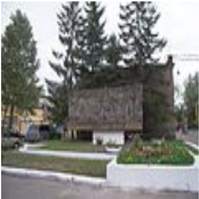
Барельеф в честь погибших кировцев.