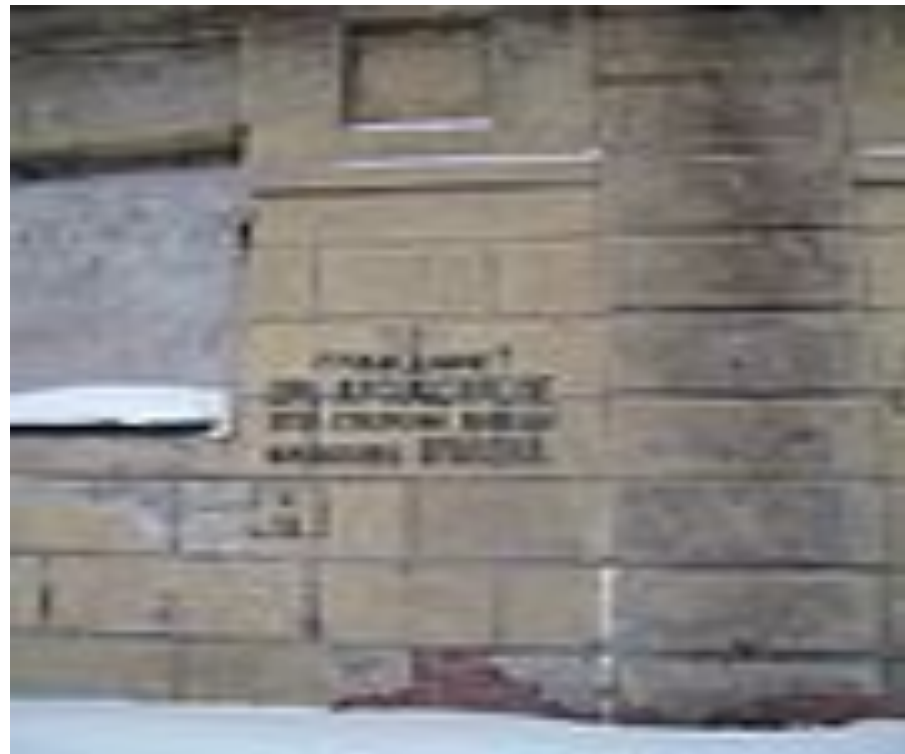
Граждане! При артобстреле эта сторона улицы наиболее опасна.