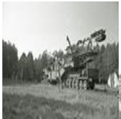
305 мм орудие на ж.д. транспортёре (вид с казённой части)