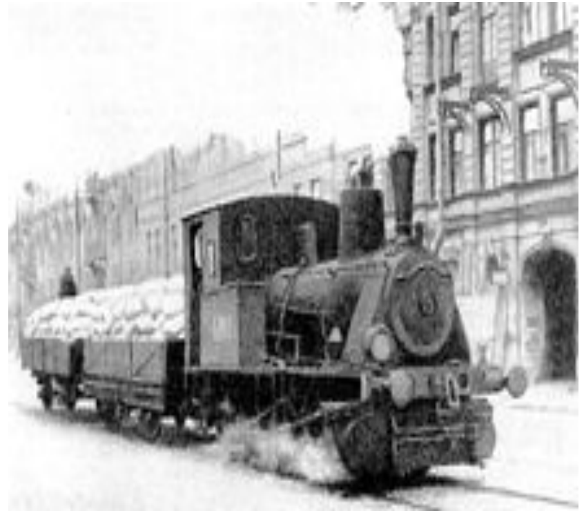
Паровоз везёт муку по трамвайным рельсам в блокадном Ленинграде, 1942 год