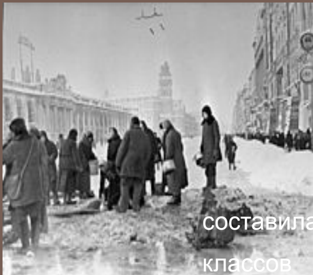
составила учитель начальных классов