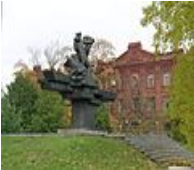
Памятник Героям — морякам-балтийцам