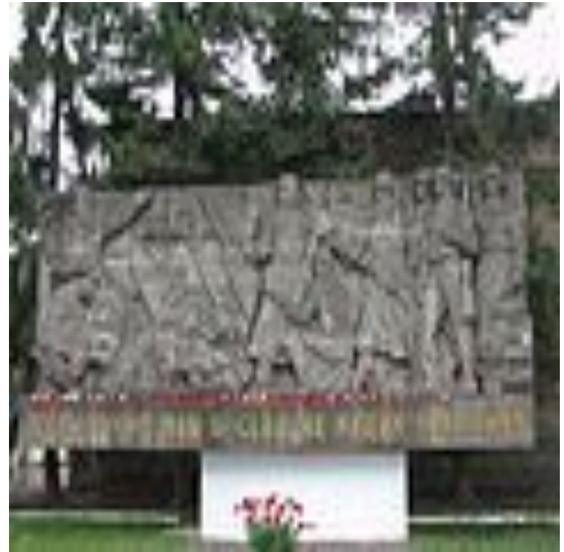
Барельеф в честь погибших кировцев—жителей блокадного Ленинграда (ул. Маршала Говорова, д. 29).