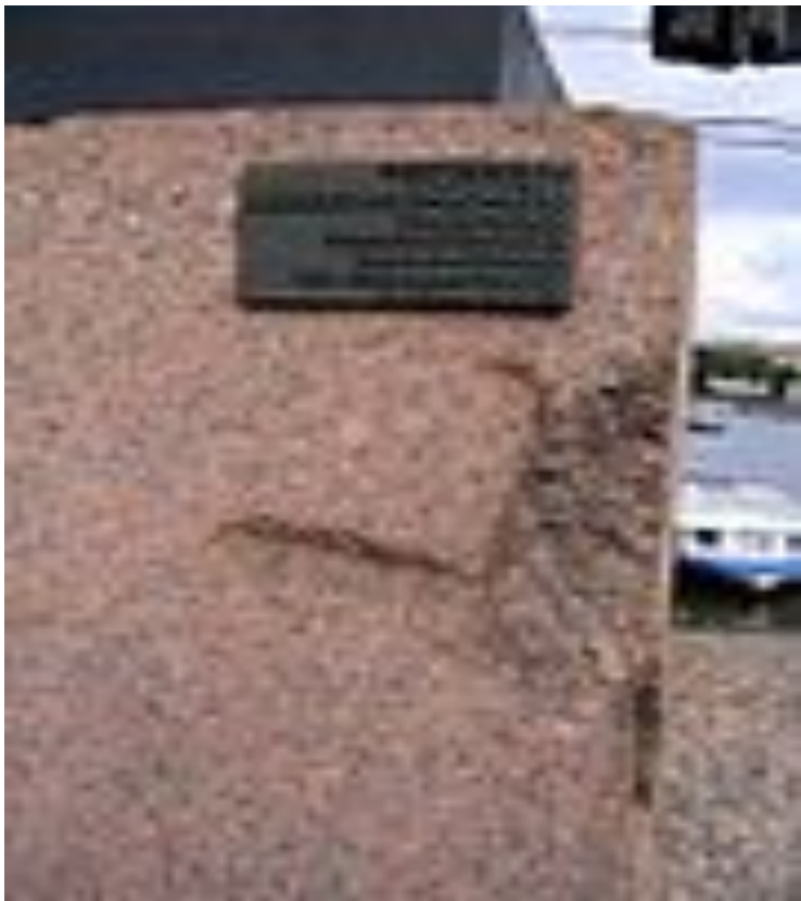
След от немецкого артиллерийского снаряда