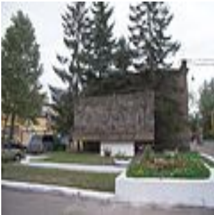
Барельеф в честь погибших кировцев.