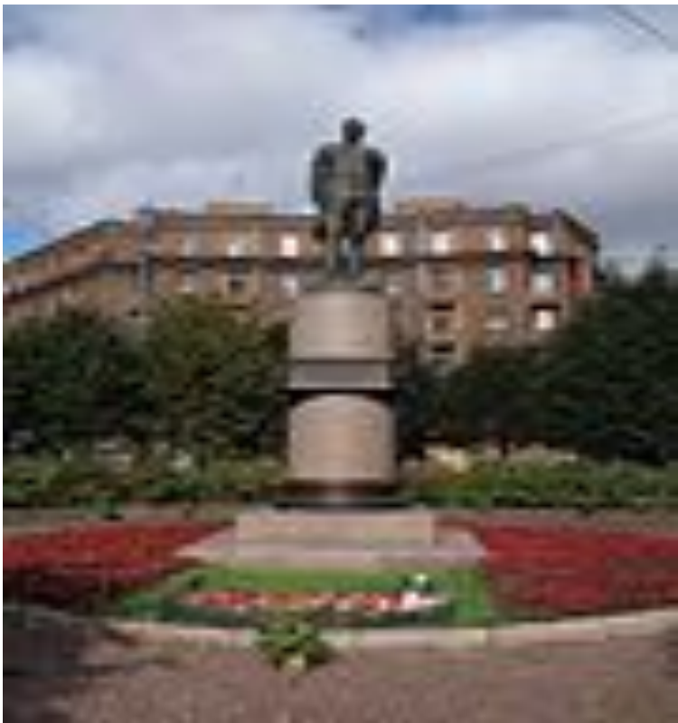
Памятник Л. А. Говорову, площадь Стачек, Санкт- Петербург.