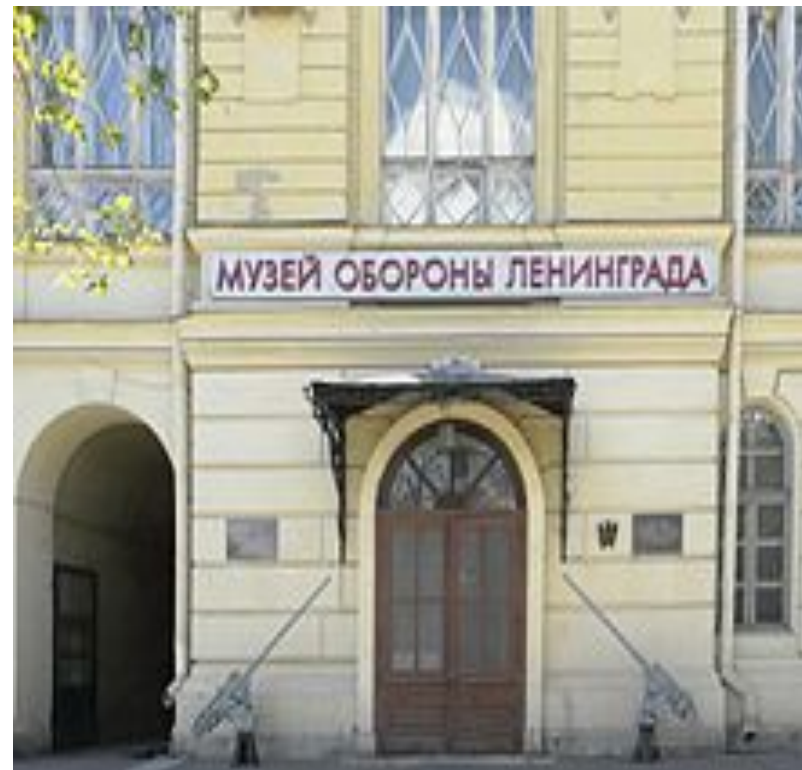
Вход в музей (лето 2007)