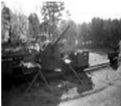
180 мм орудие на ж.д. транспортёре