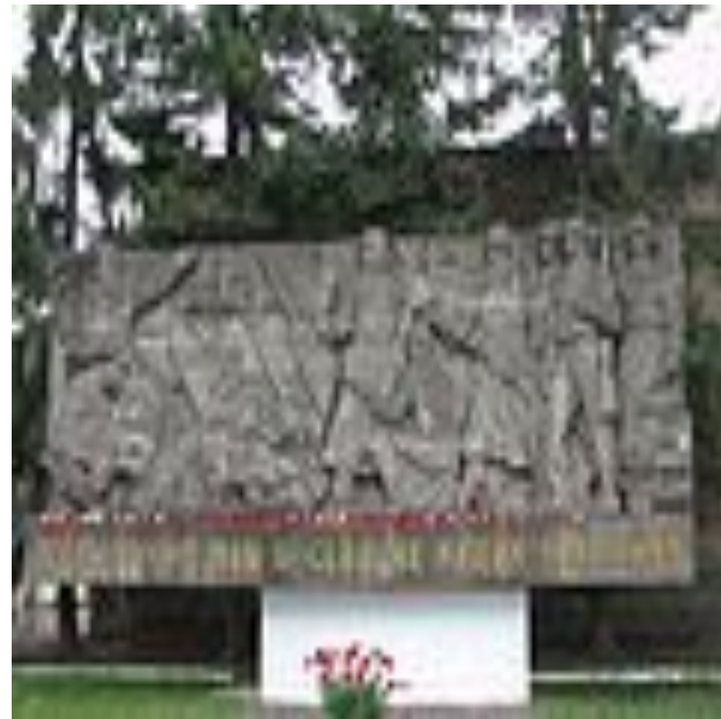
Барельеф в честь погибших кировцев—жителей блокадного Ленинграда (ул. Маршала Говорова, д. 29).