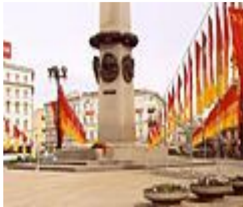
Обелиск «Городу-герою Ленинграду»