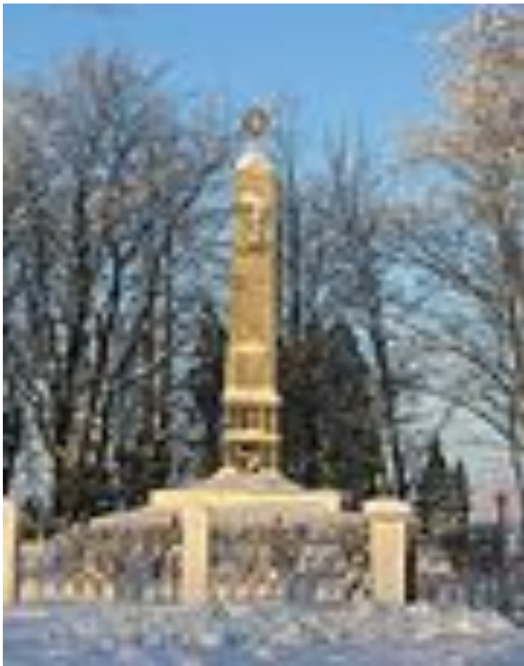
Ивановский пяточок, часть Зелёного пояса Славы. Обелиск в городе Отрадное Ленинградской области