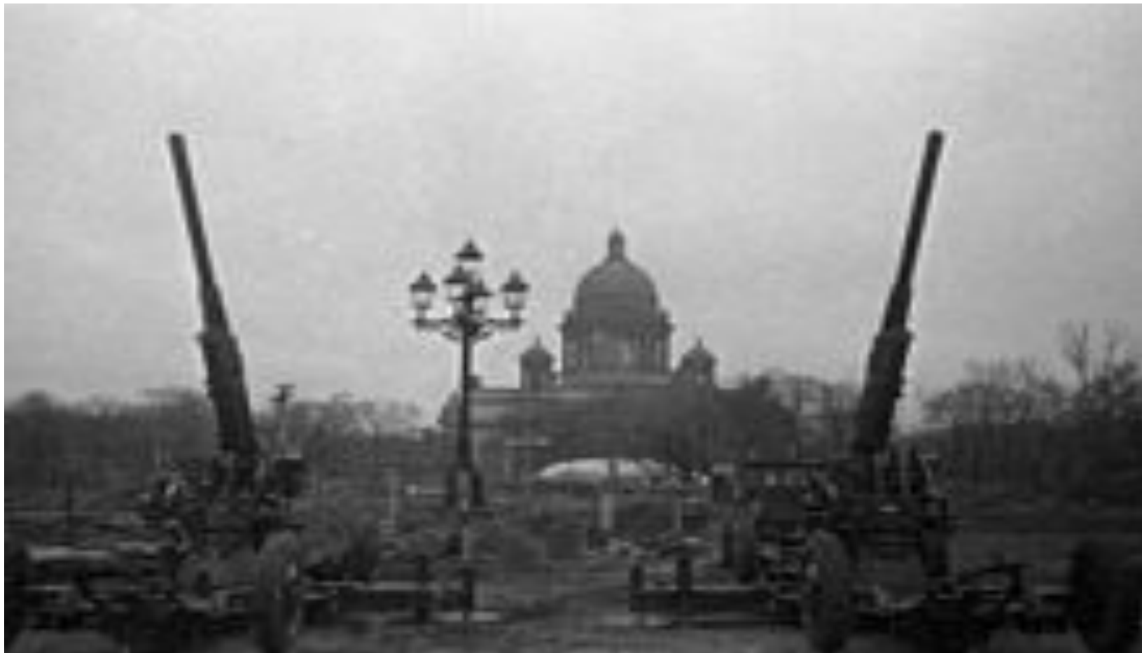
«Зенитчики на страже Ленинградского неба», октябрь 1941