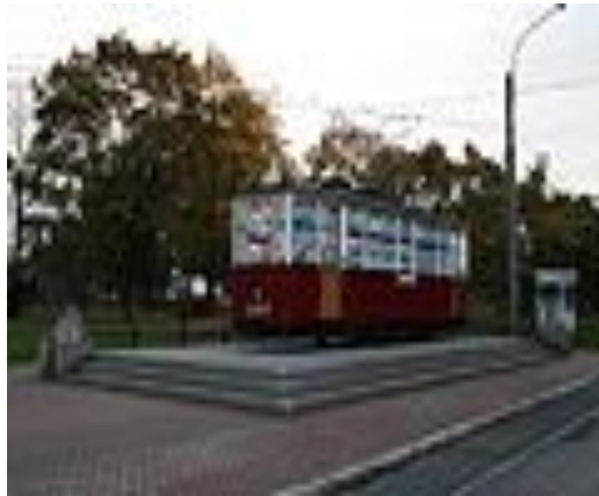
Трамвай типа МС, установленный в честь столетия Петербургского трамвая.