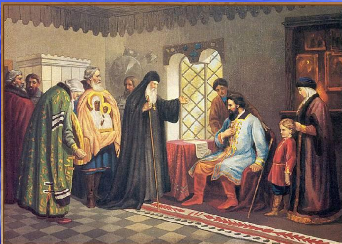
Нижегородские послы у князя Дмитрия Пожарского. 1611 г.

Военным руководителем ополчения стал князь Д. М. Пожарский.