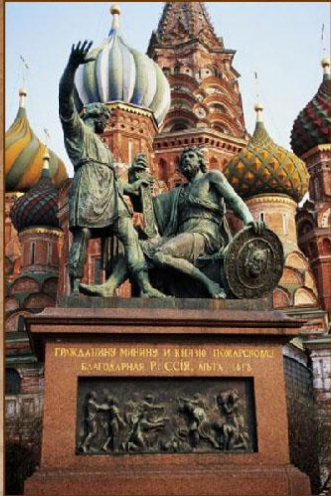
Памятник Минину и Пожарскому