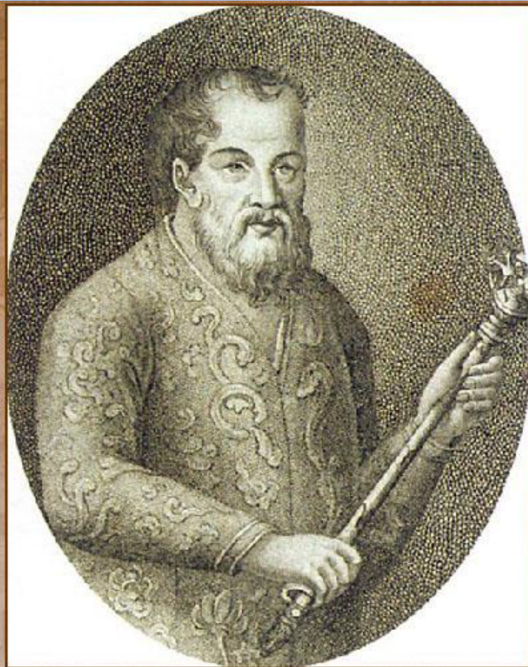
Пожарский Д.М., князь, глава Ямского приказа