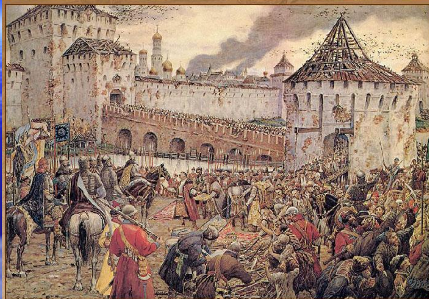
Изгнание польских интервентов из Московского Кремля в 1612 г.