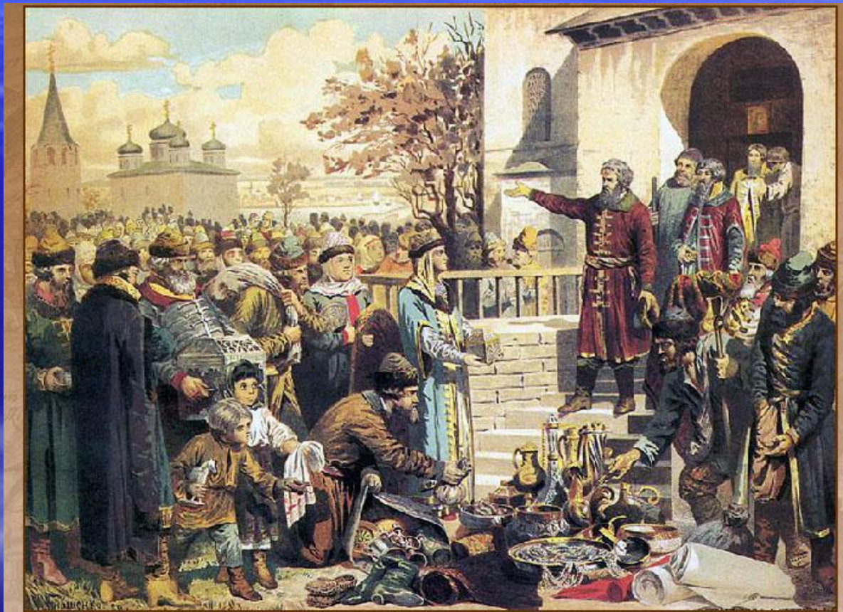
Воззвание Козьмы Минина к нижегородцам