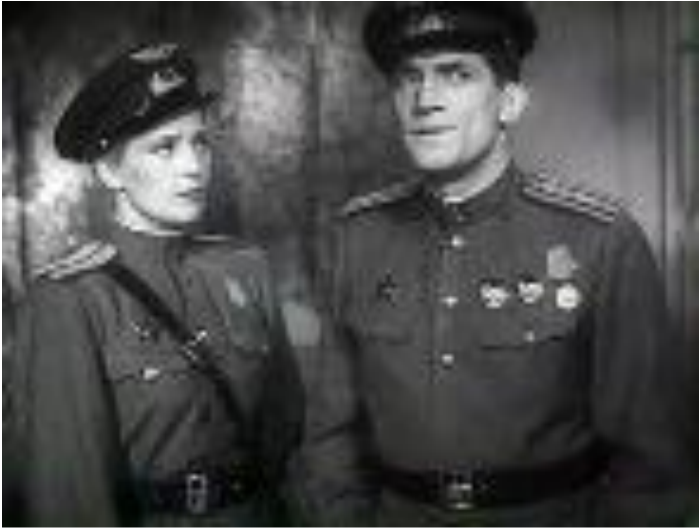
Кадр из фильма «Небесный тихоход»