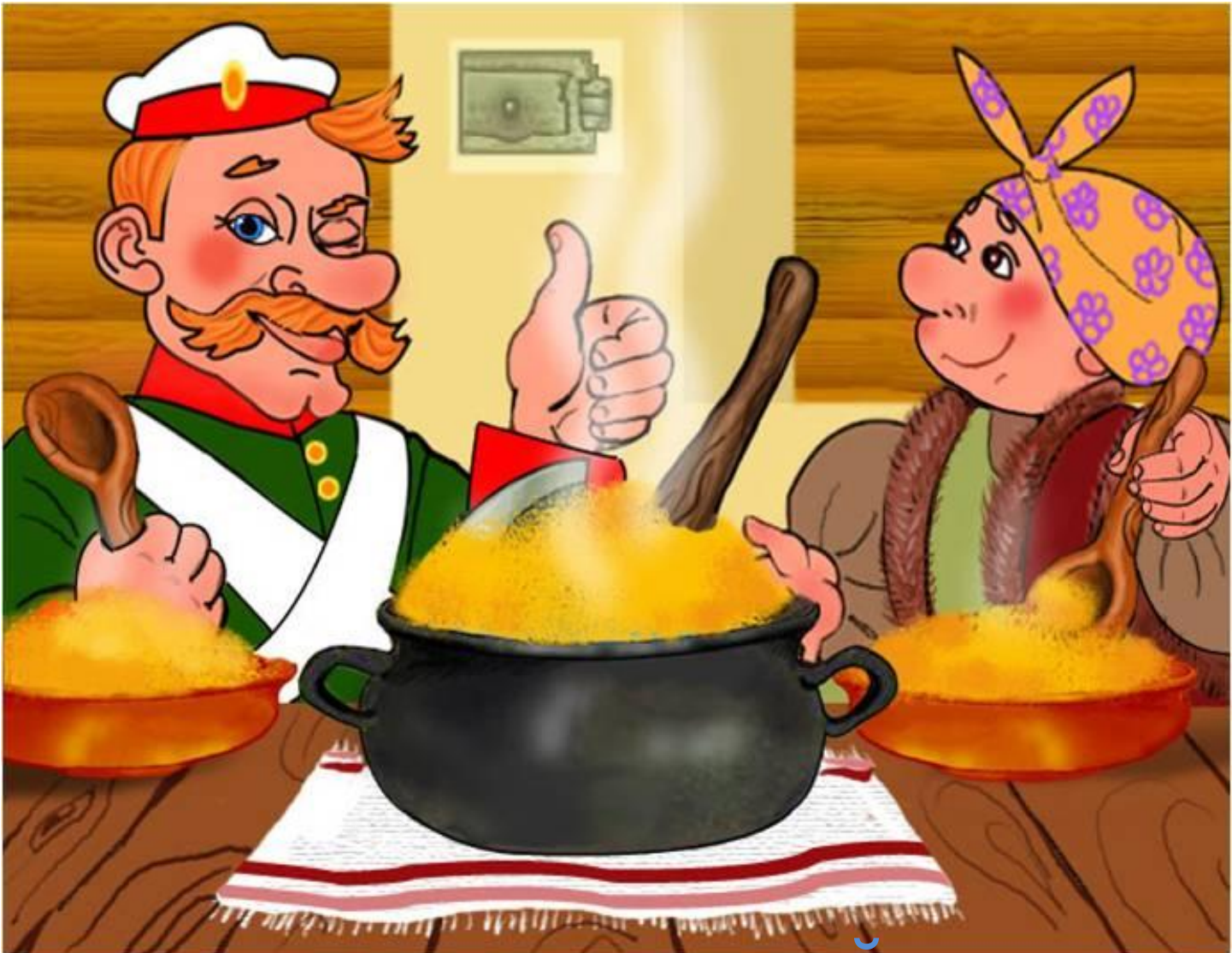
Иллюстрация к русской народной сказке «Каша из топора»