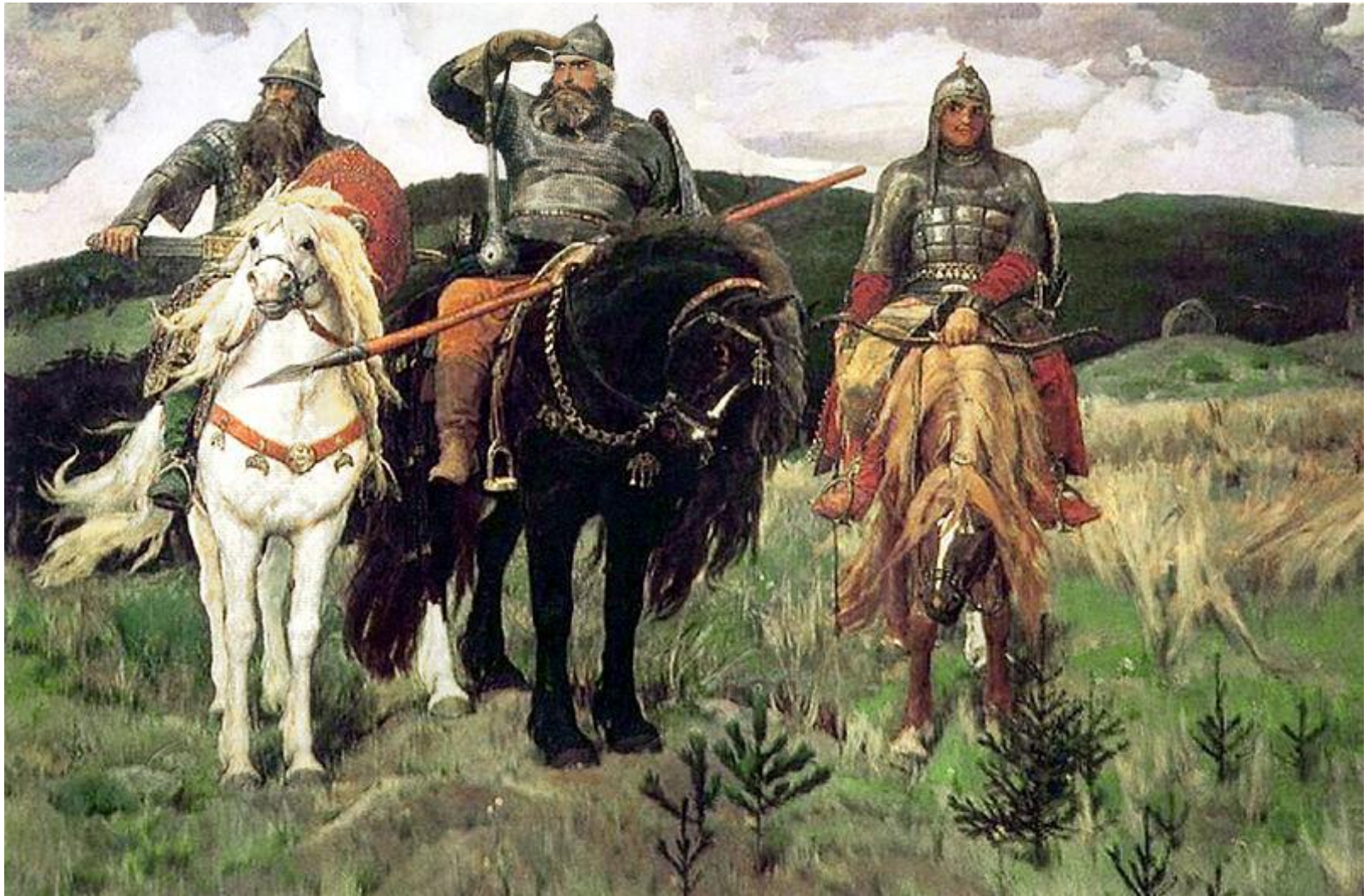
Репродукция картины Васнецова «Три богатыря»