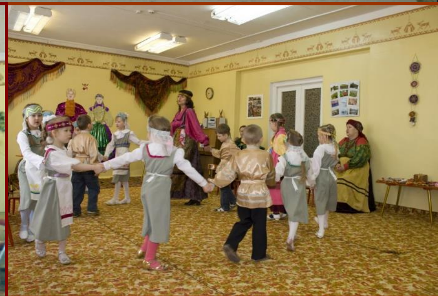
Коми посиделки, вечера-развлечения народные игры, спортивные праздники