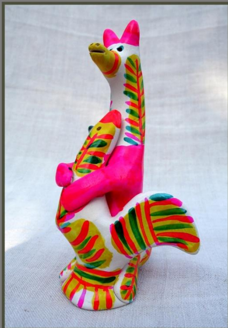
лиса с петухом