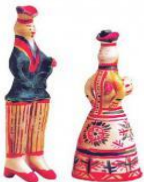
Солдат и барыня

«Солдаты» высокие, в характерных костюмах, с погонами, полосатых или цветных штанах, в необычных сапогах на высоком каблуке.