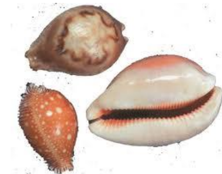
Раковины Каури (Приморье)