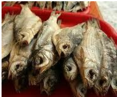
Сушёная рыба (Исландия)