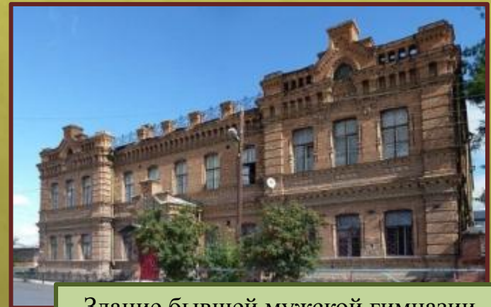
Здание бывшей мужской гимназии. Закладка гимназии состоялась в 1893 году.

Торжественное открытие памятника Екатерине II состоялось на главной площади города 23 августа 2013 года. Обновленная императрица является точной копией дореволюционного монумента.