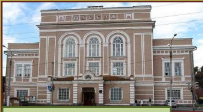
Здание Пассажа было заложено в 1856 году.

*В Ирбите сохранилось множество старинных домов второй половины XIX – начала XX веков - памятников архитектуры. Их количество в Ирбите – самое большое среди всех городов Свердловской области (за исключением Екатеринбурга).