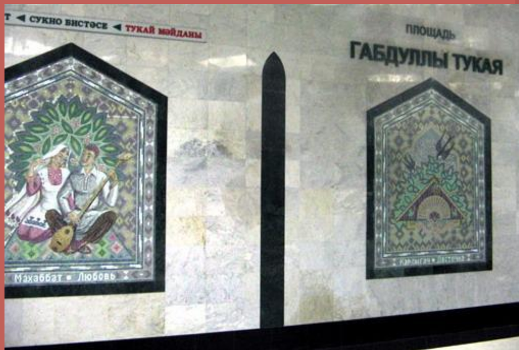
Станция метро «Площадь Габдуллы Тукая» в Казани

В честь Габдуллы Тукая назван ряд площадей и улиц: площадь в Казани, а по ней и станция метро, улицы в Уфе, Уральске, сёлах Новый Кырлай Арского района Татарстана, Шаранбаш-Князево Шаранского района Башкортостана, селе Даутово городского округа Верхний Уфалей Челябинской области.