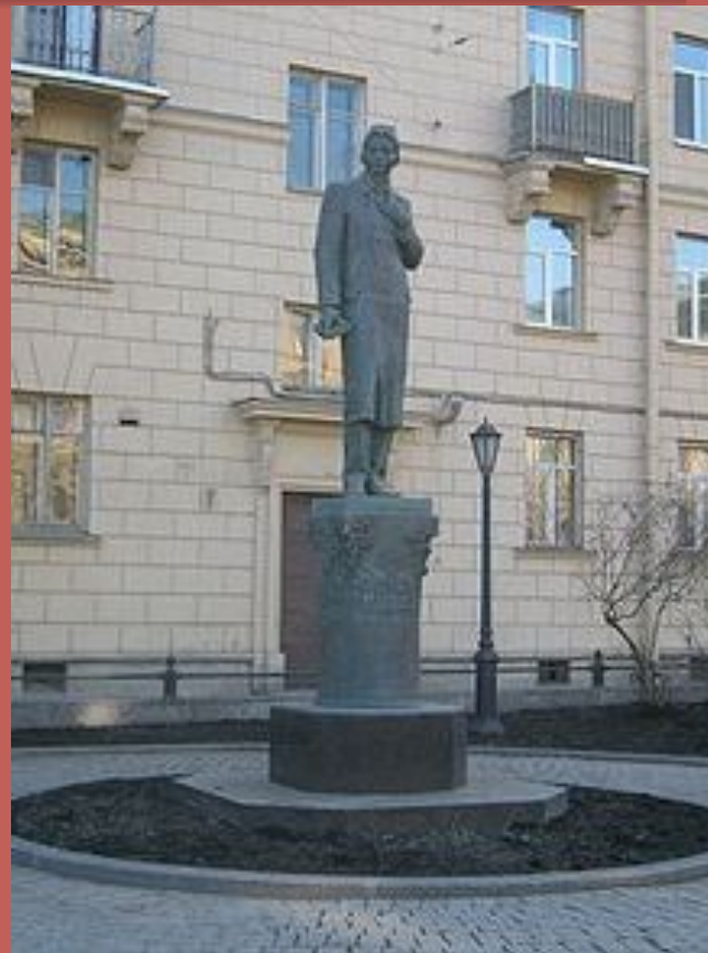
Памятник Г. Тукаю в Санкт-Петербурге