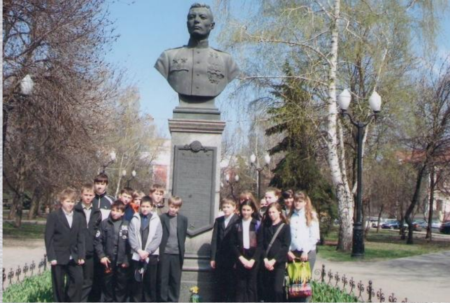
Бюст дважды Героя Советского Союза В. Петрова в Тамбове.

Не оставил военную службу Петров и после окончания войны, к 1977-му дослужившись уже до генерал-лейтенанта. Последние годы замещал командующего Ракетных войск и артиллерии главкома украинских Сухопутных войск.