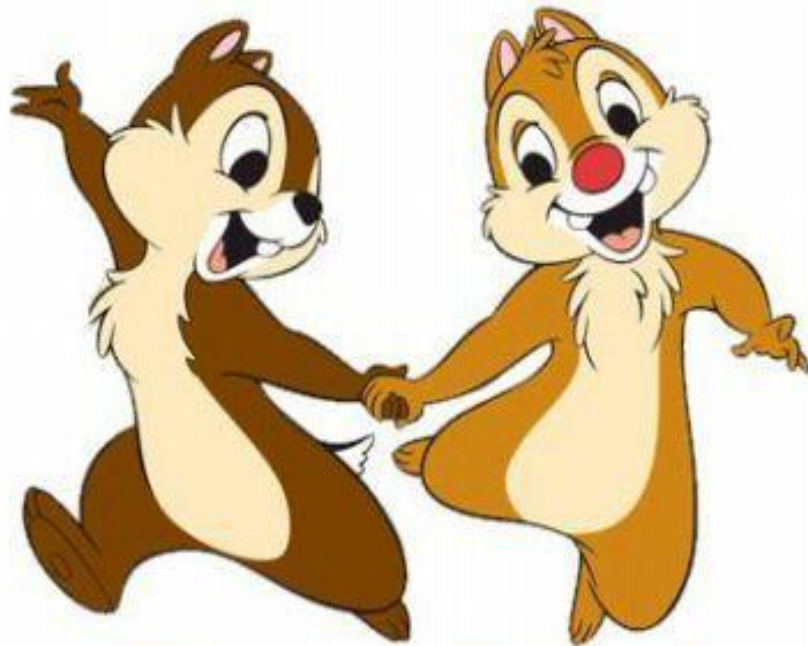
Chip and Dale