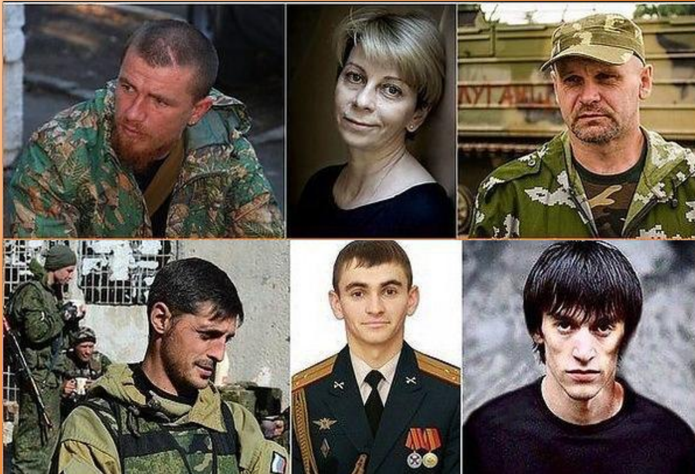
Герои нашего времени