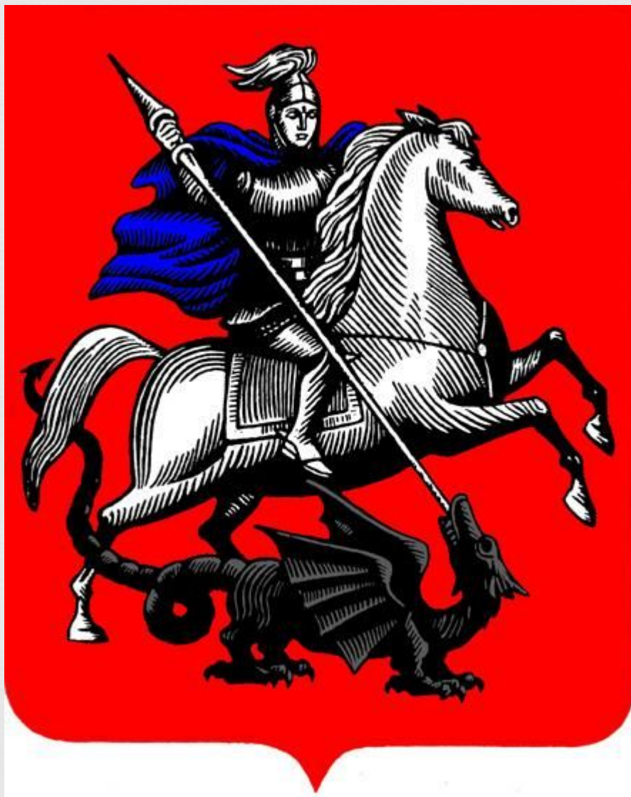
Герб города Москва