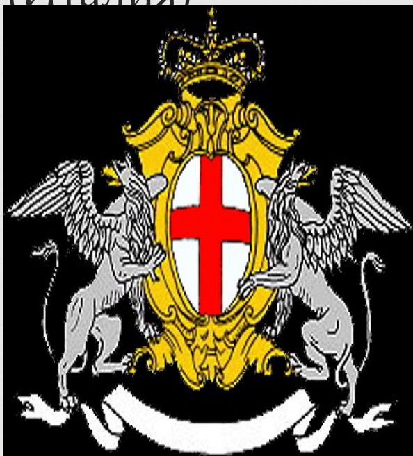
Герб города Генуя (Италия)