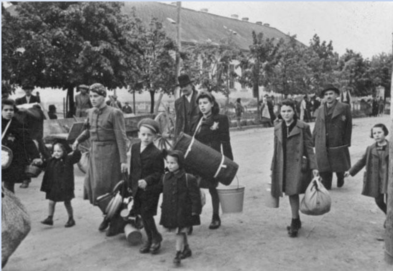
Еврейские семьи переезжают в гетто