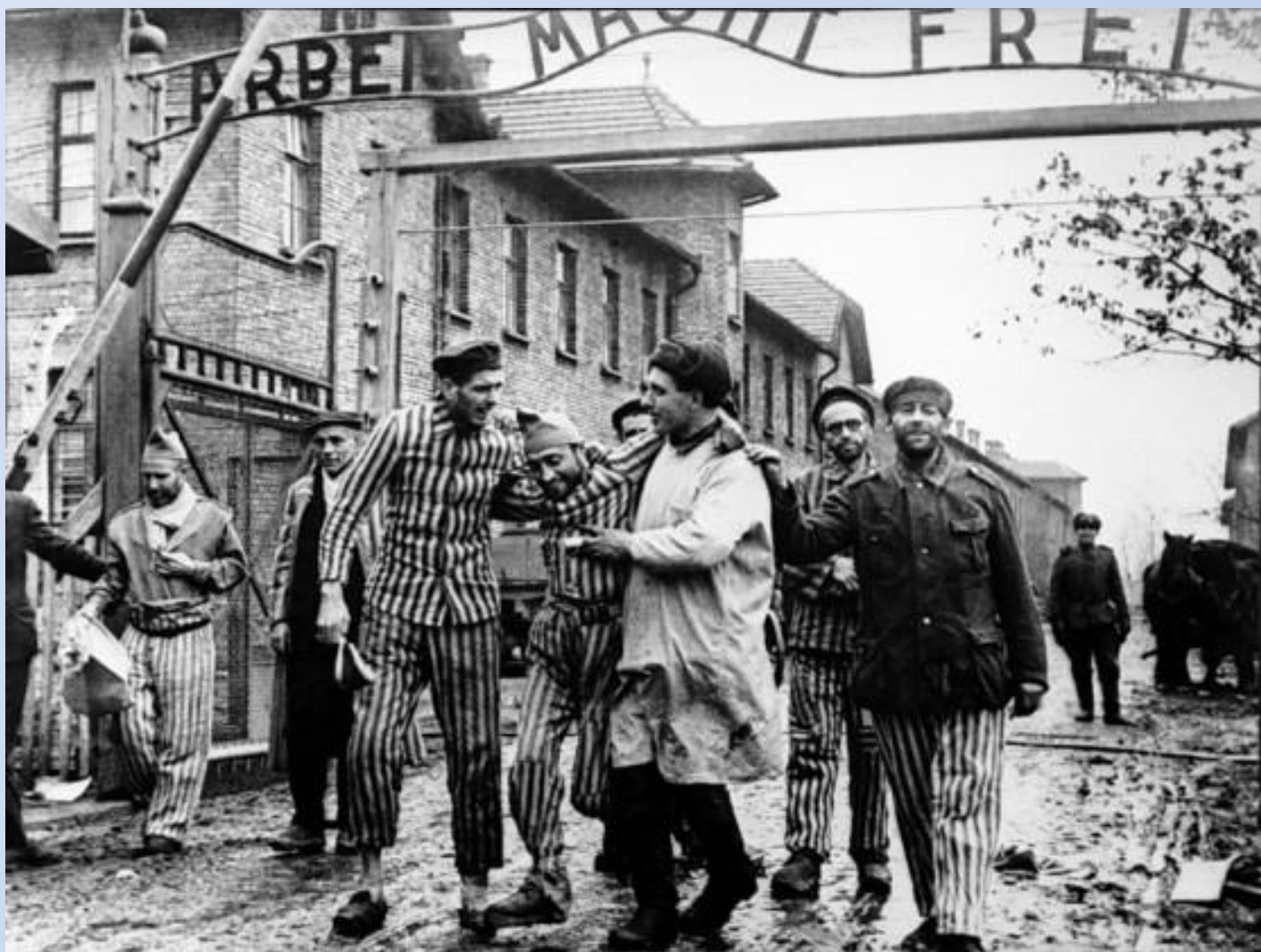
Освобождение советскими солдатами заключенных из лагеря Освенцим