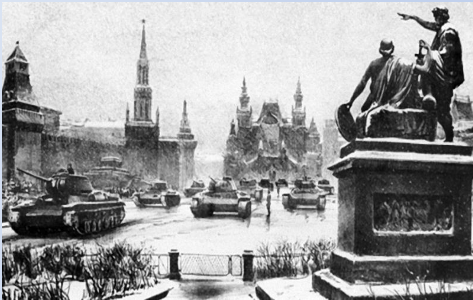
Битва за Москву