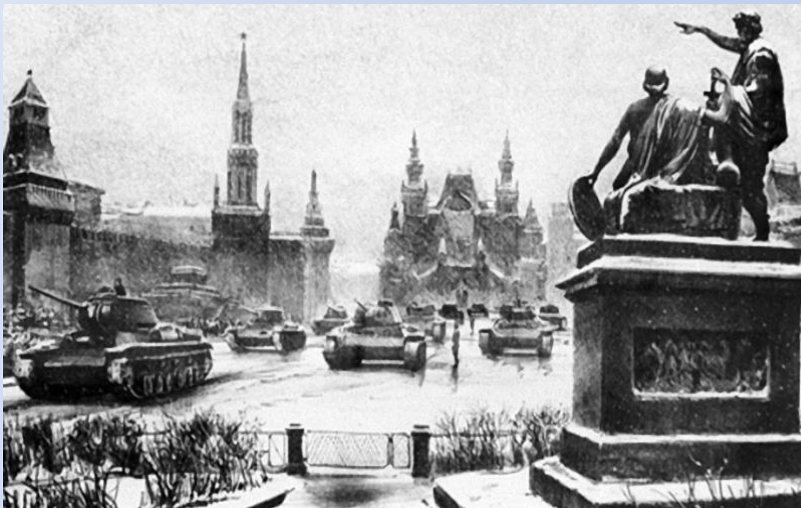
Битва за Москву