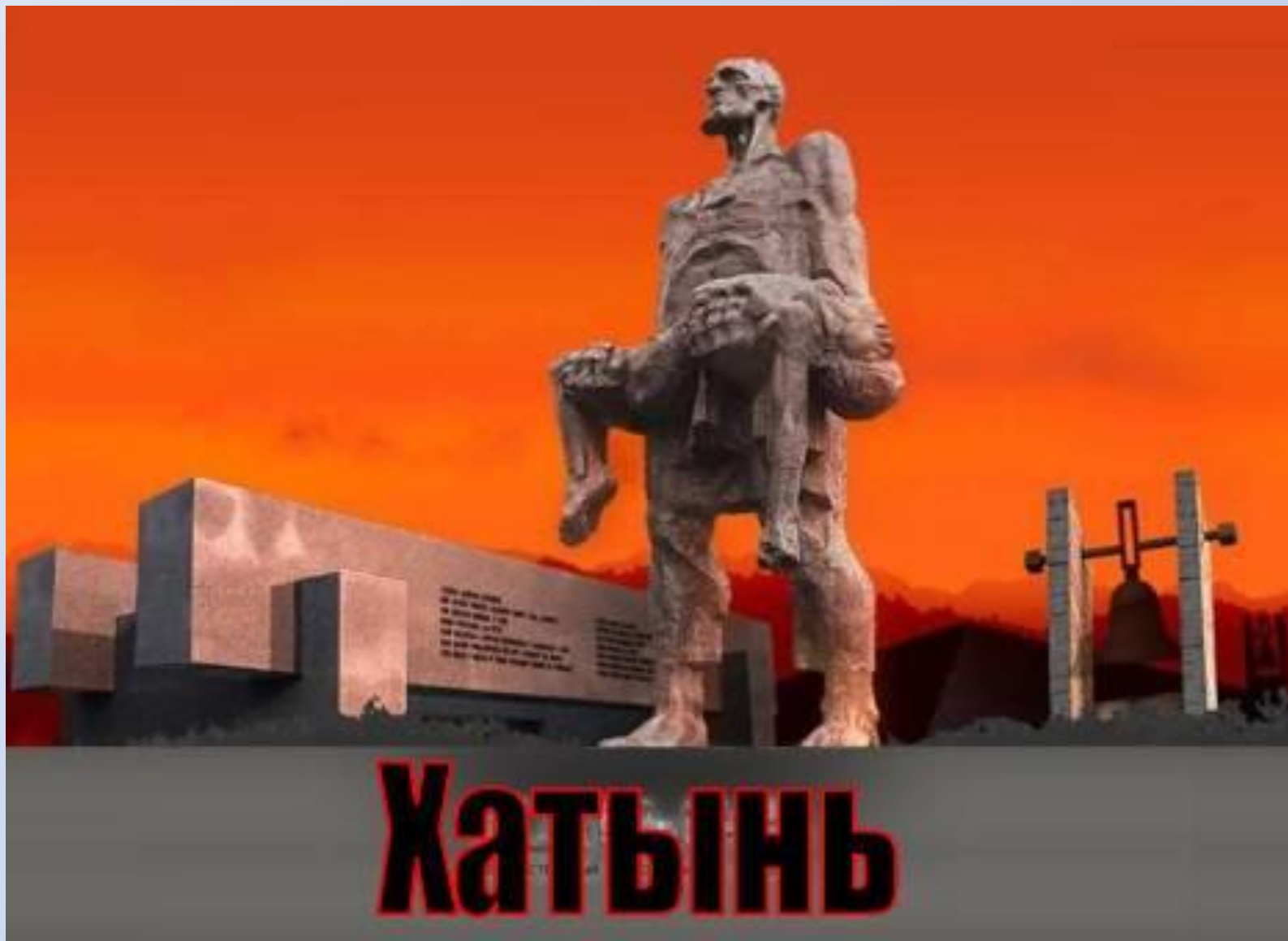
Мемориальный комплекс под Минском.