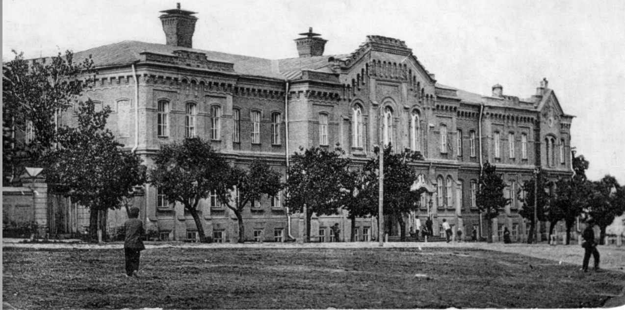
Благородъ. Мужская Е.К.В. Герцога Единбургскаго Гимназія.

В гимназиях преподавали гуманитарные предметы, среди которых – древние языки, русский язык и литература, иностранные языки, история, Закон Божий, логика, география, рисование и т. д. Главной целью этих учебных заведений было подготовить воспитанников к поступлению в университеты. Обучались в них девять лет (год в подготовительном классе и 8 лет в гимназии).