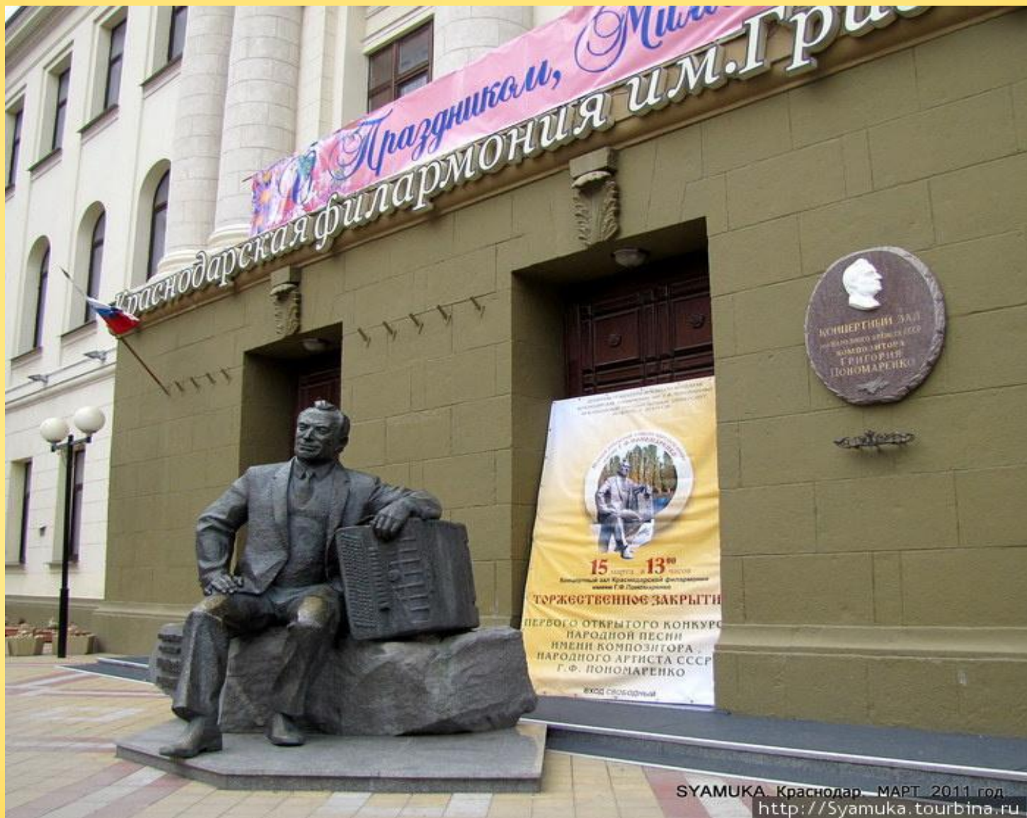
SYAMUKA Краснодар МАРТ 2011 год http://Syamuka.tourbina.ru