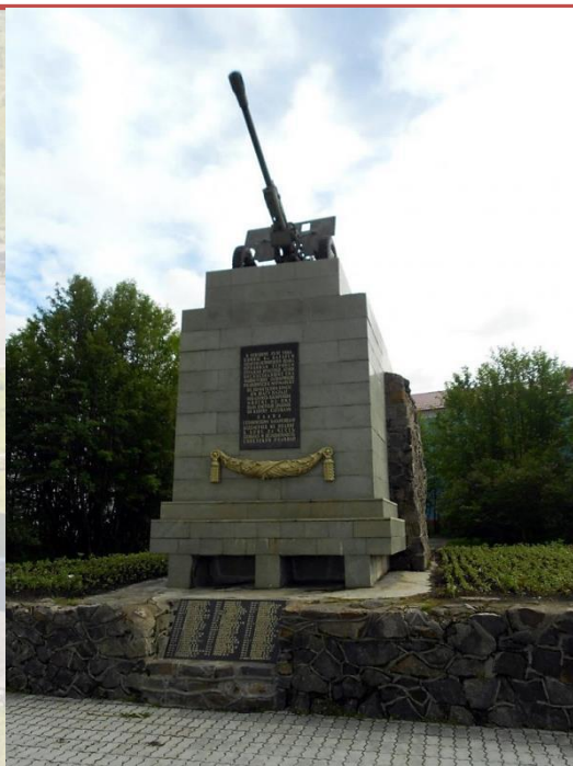
ПАМЯТНИК ВОИНАМ 6 ГЕРОИЧЕСКОЙ КОМСОМОЛЬСКОЙ БАТАРЕИ