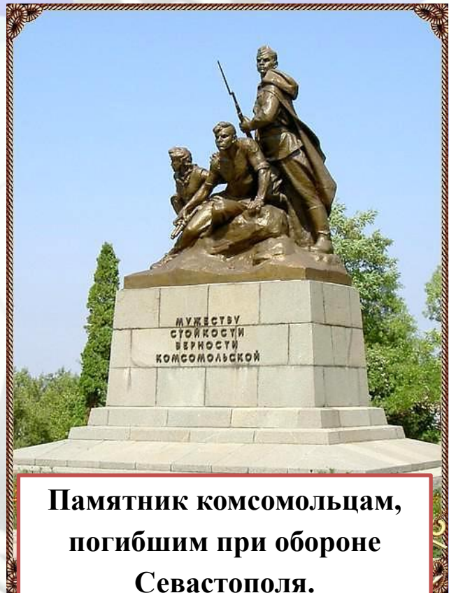
Памятник комсомольцам, погибшим при обороне Севастополя.

В НАСТОЯЩЕЕ ВРЕМЯ СОБЫТИЯ ГЕРОИЧЕСКОГО ПРОШЛОГО ОТОБРАЖАЮТ МНОГИЕ СЕВАСТОПОЛЬСКИЕ ПАМЯТНИКИ И МУЗЕИ.