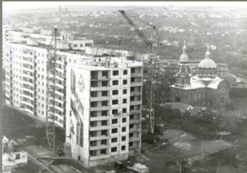
Кинотеатр «Быль». г. Старый Оскол. 1980-е гг.