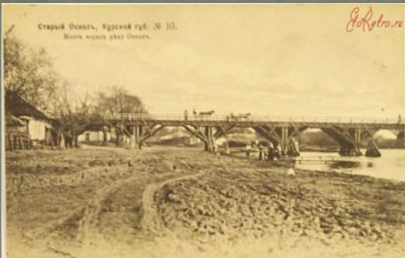
Старый-Осколь. Слобода Казачья.