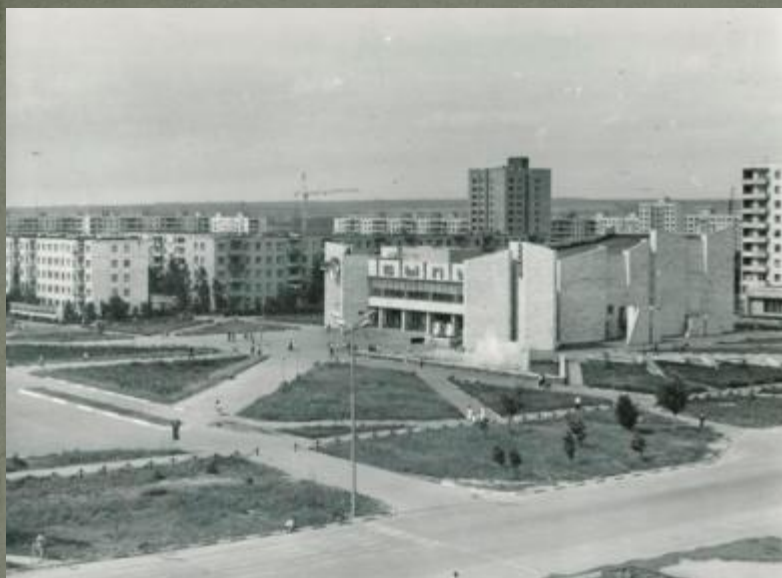
Кинотеатр «Быль». г. Старый Оскол. 1980-е гг.