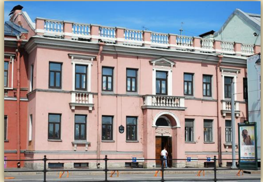
Дома для именитых. 1720 – 1730 гг.