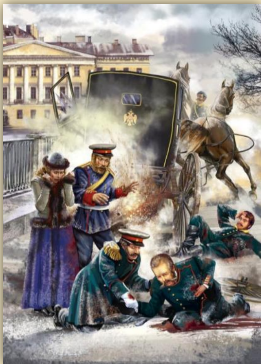
1 марта 1881 г.