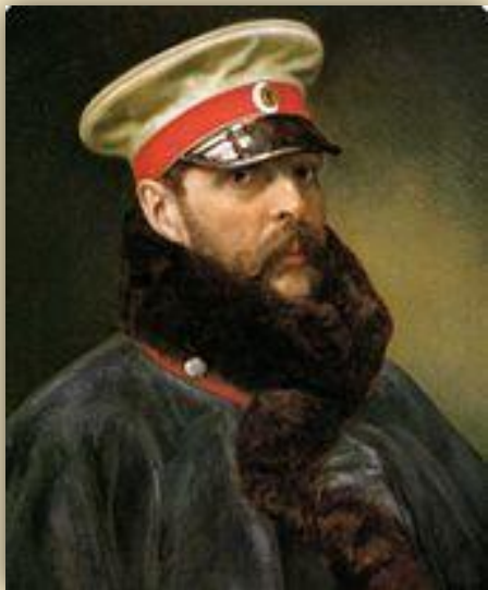
Император Александр II