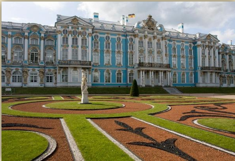
Екатерининский дворец в