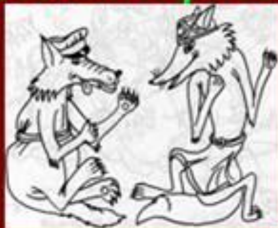
Как Лиса с Волком наперегонки считали (латышская сказка)