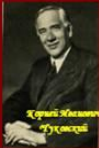
Константин Максимович Гуковский