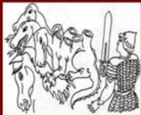
Иван – крестьянский сын и чудо-юдо (русская сказка)