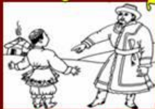
Если от 4 отнять 4 (казахская сказка)