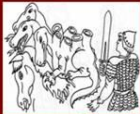
Иван – крестьянский сын и чудо-юдо (русская сказка)