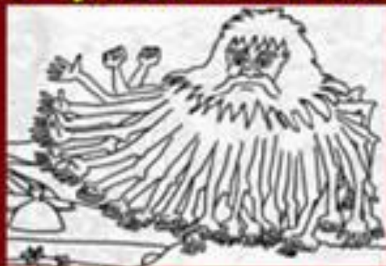
Иван Туртыгин (русская сказка)