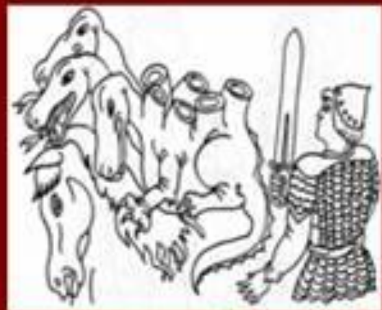
Иван – крестьянский сын и чудо-юдо (русская сказка)