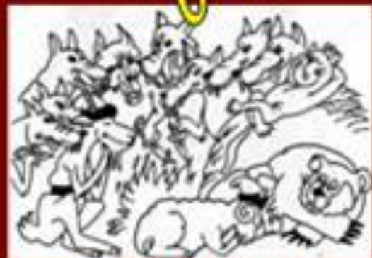
Кот – серый поб, козёл да баран (русская сказка)