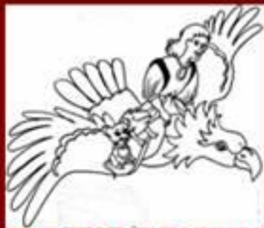
Джек и золотая табакерка (английская сказка)