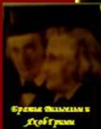
Братья Вильгельм и Якоб Гримм