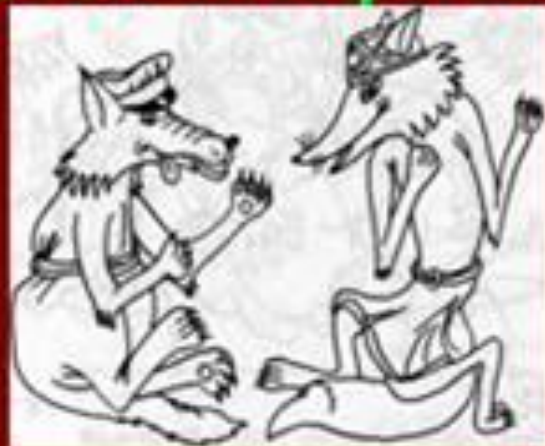
Как Лиса с Волком наперегонки считали (латышская сказка)