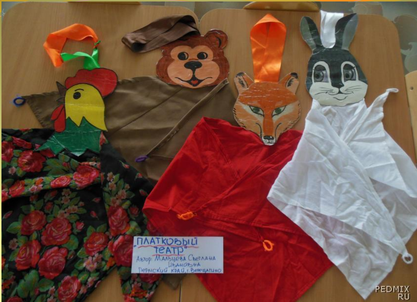
ПЛАТКОВЫЙ ТЕАТР Автор: Мальцева Светлана Цыгановна Пермский край, г. Верещаино