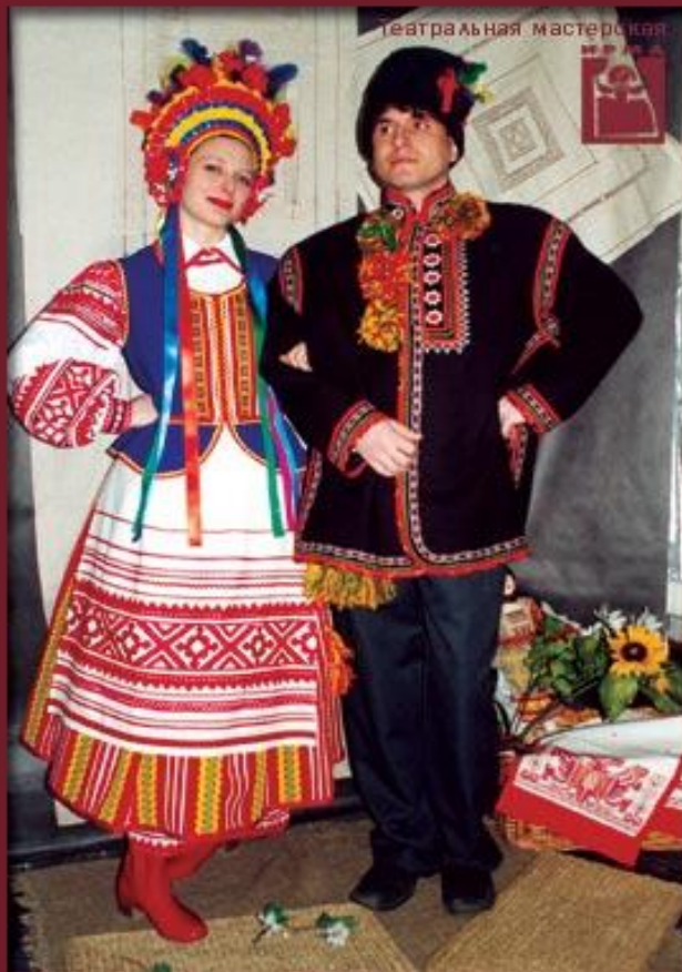
"Украинский" г.Мирный (художник И.Имарионова)