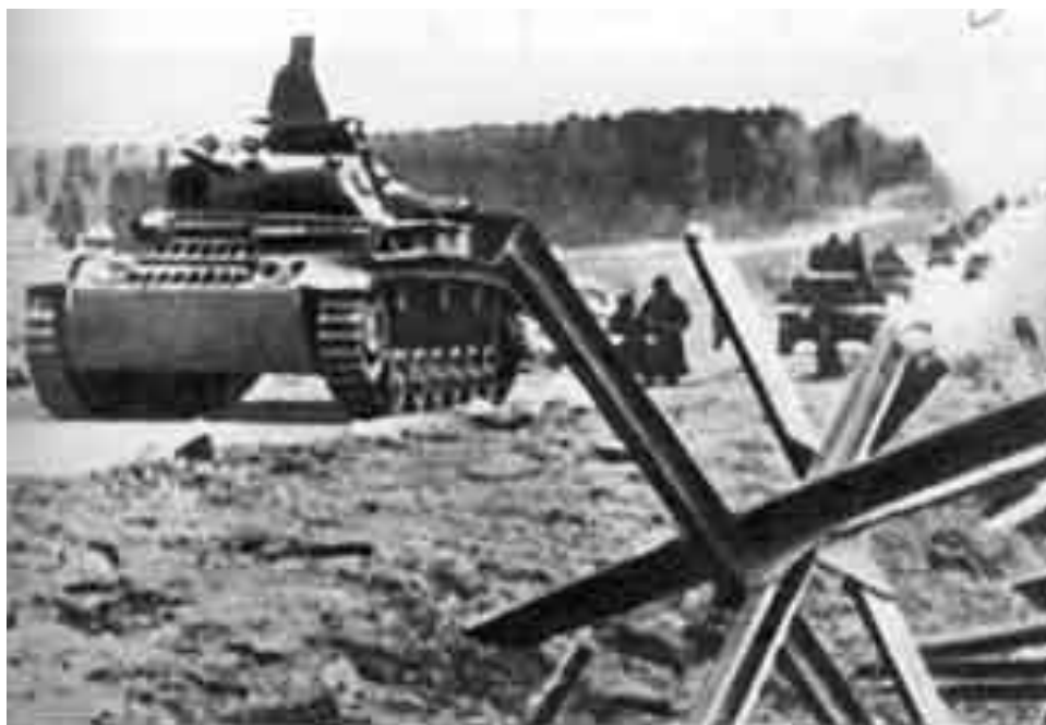
Немецкие танки на Варшавском шоссе

5 октября ребят военных училищ подняли по тревоге.