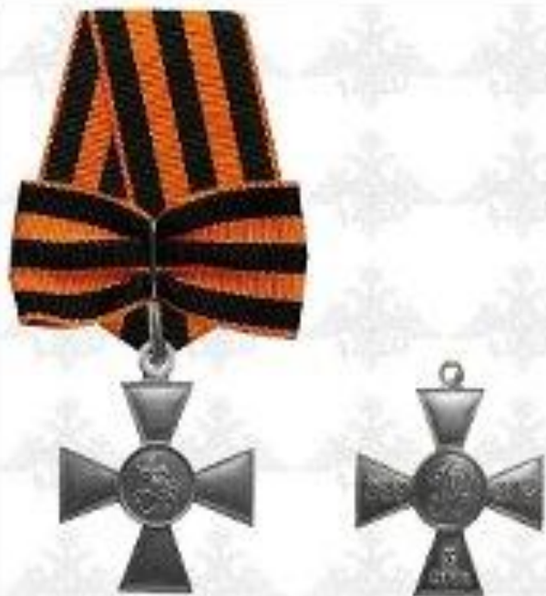
Отечественная война III степени