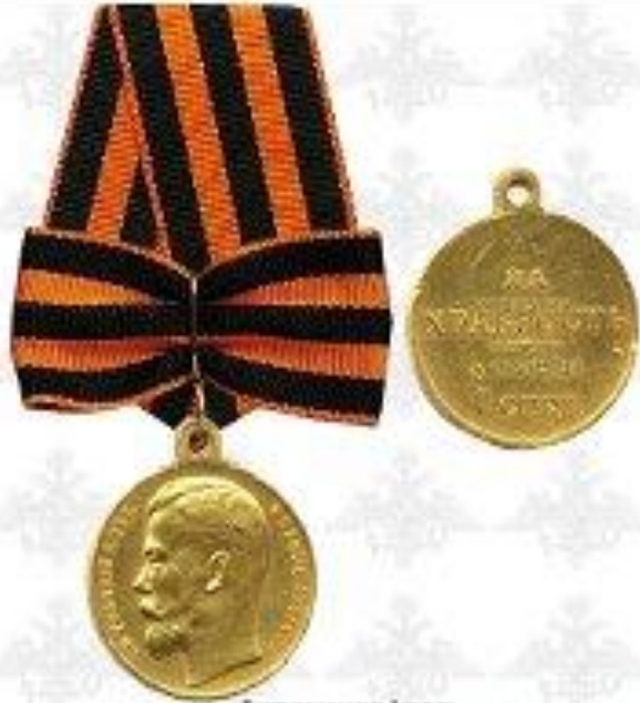
Отечественная война I степени