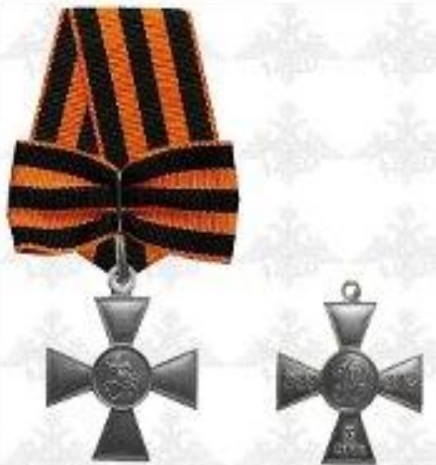
Отечественная война III степени