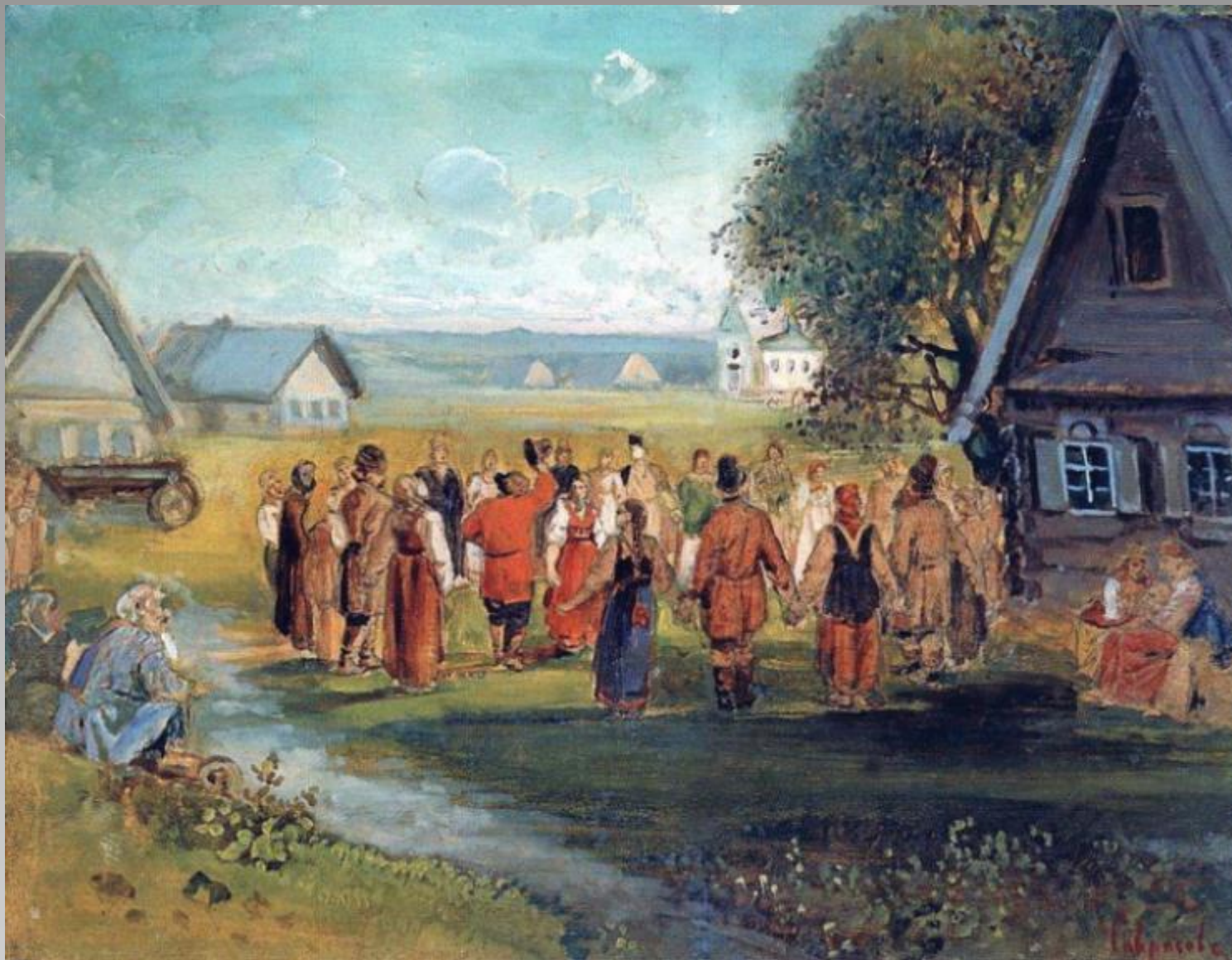
Летом водили хороводы...