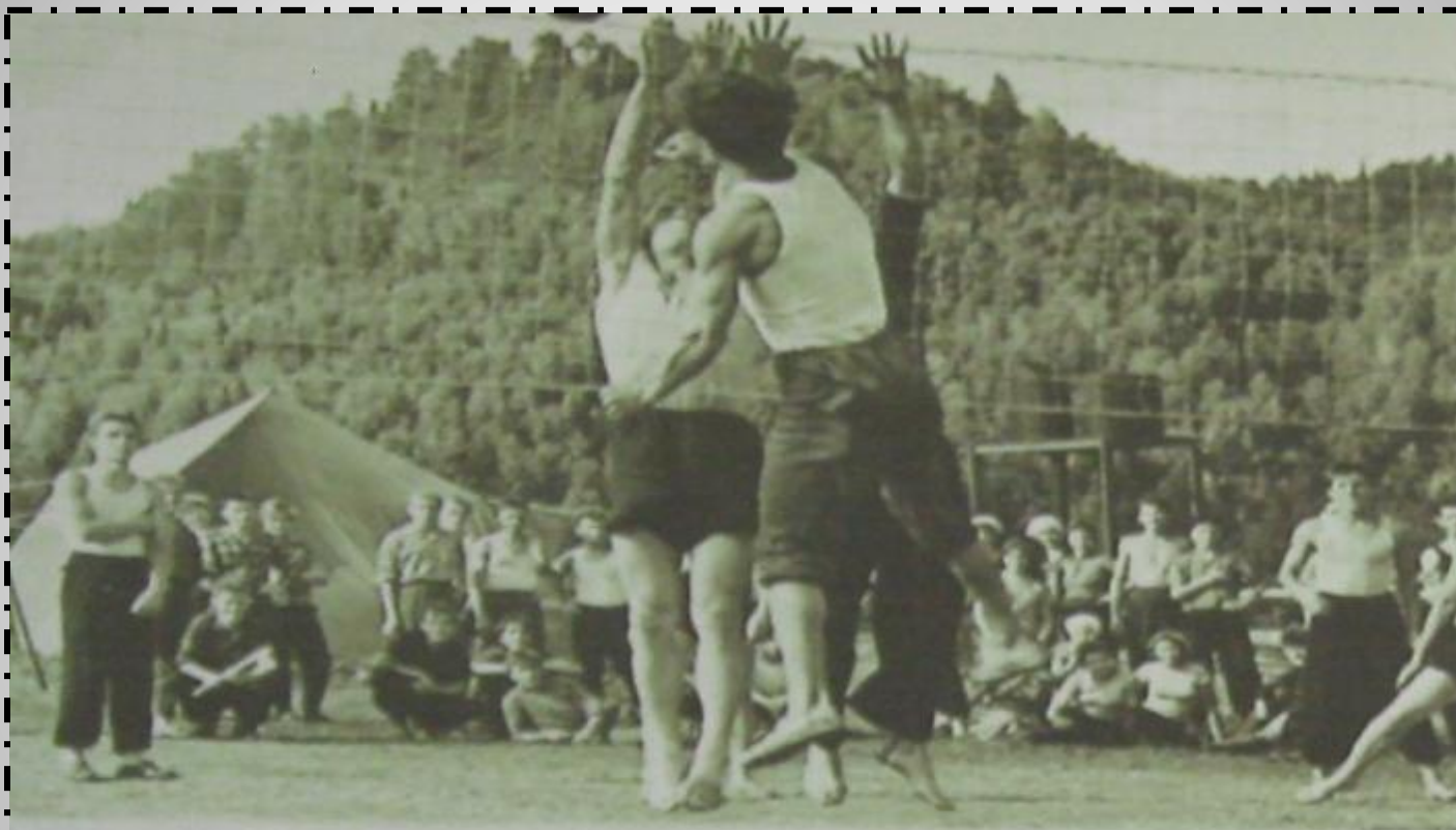
Спортивные батальоны в палаточном городке

1964-й год стал годом рождения коллектива физкультуры Западно-Сибирского металлургического завода, который уже к концу года насчитывал 793 члена ДСО, 750 физкультурников.