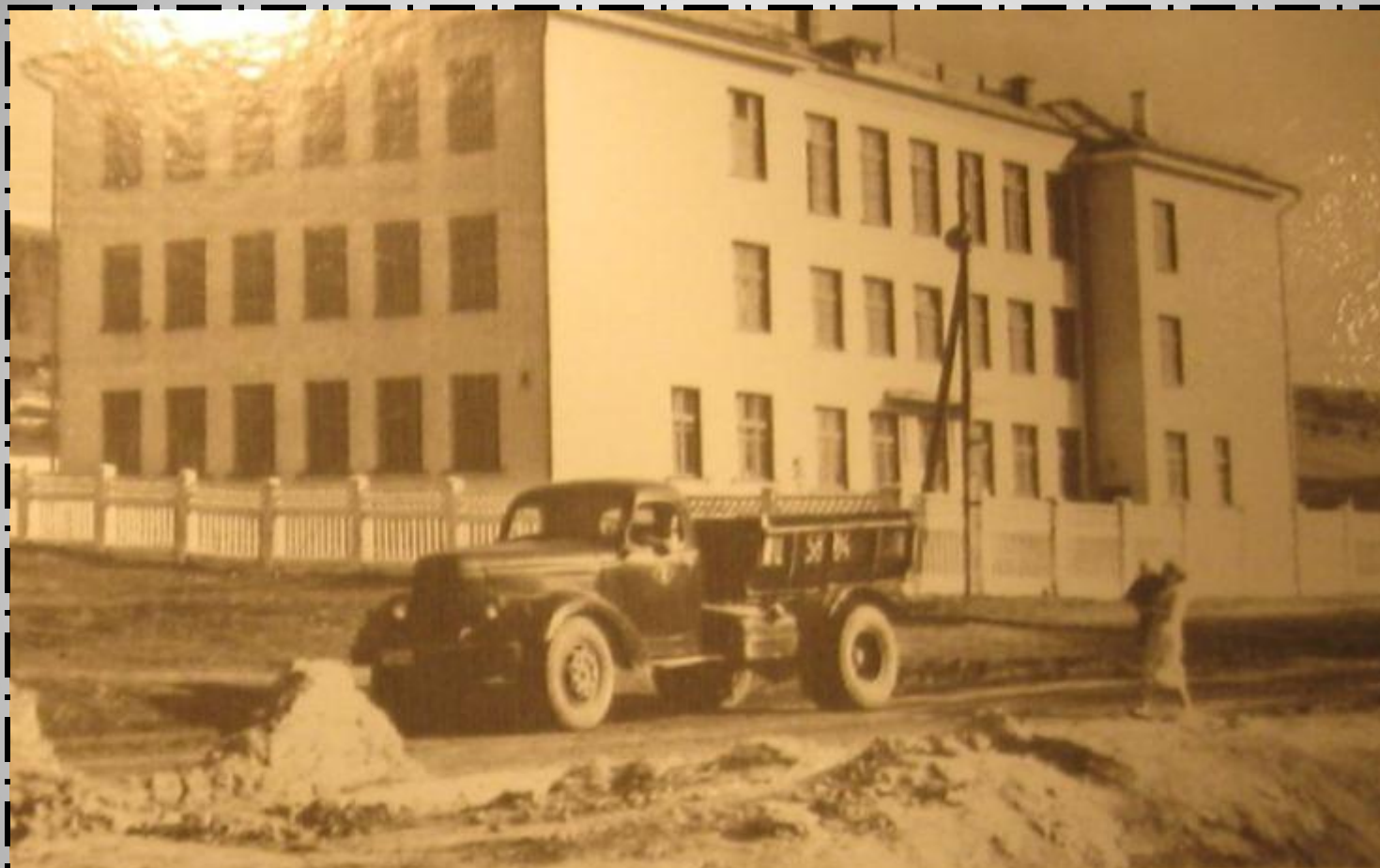
Первая школа №77.