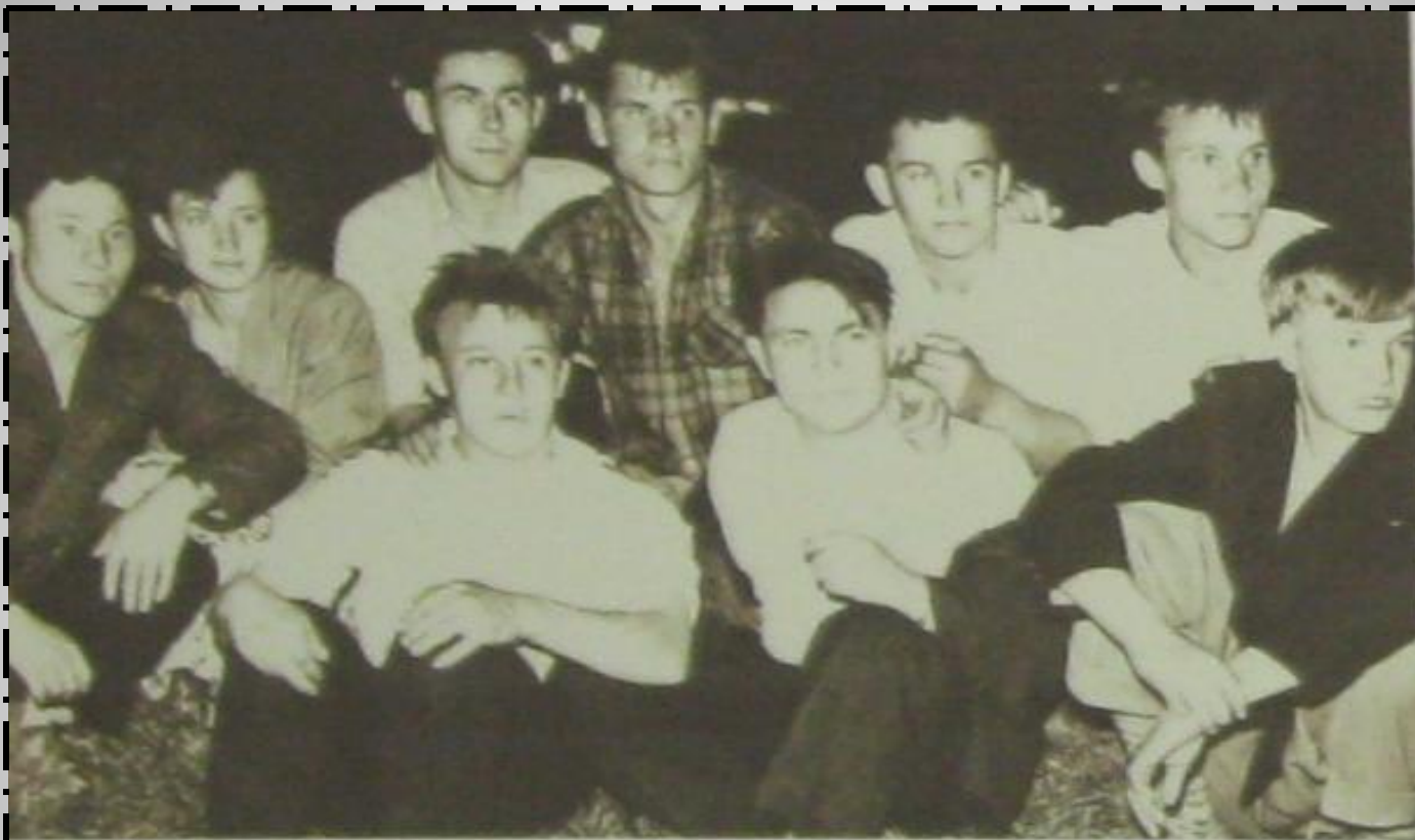
Секция бокса после тренировок

Молодёжь стройки была лидером в городских спартакиадах и соревнованиях по лыжам, волейболу, футболу, боксу. Успешно выступали штангисты и велосипедисты.