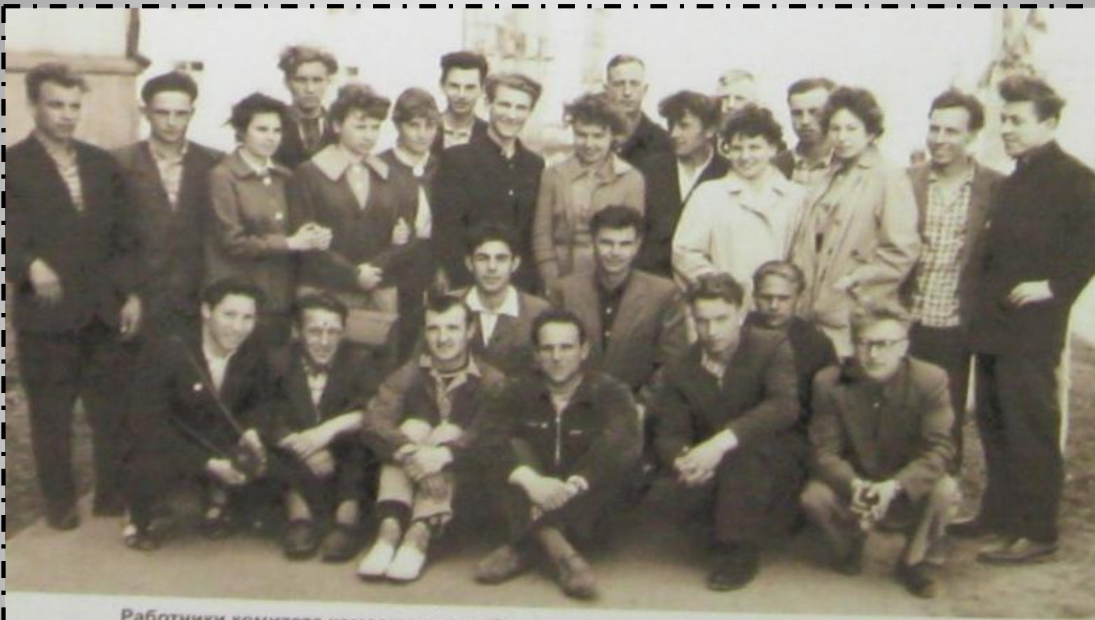
Работники комитета комсомола стройки на семинаре в Доме молодежи, 1962 год

К 1963г. Численность комсомольцев составила 13 048 человек, в том числе от Московской области – 143, Горьковской – 700, рязанской – 376, Кемеровской – 644.