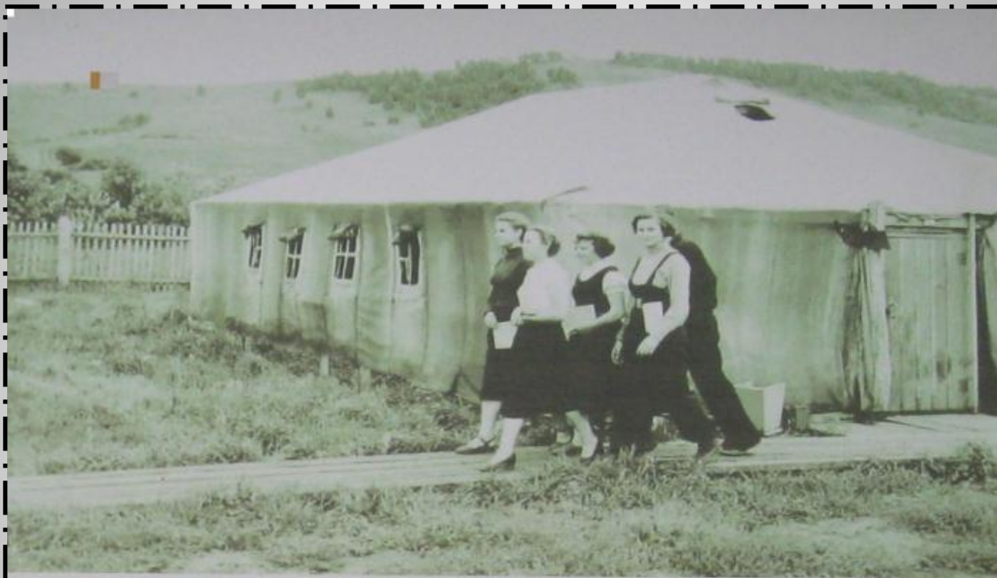
Жители палаточного городка

Это было нелёгкое время. Дорога от Новокузнецка до Запсиба была глиняной и липкой. Молодёжь на грузовиках ездила в городскую баню, потому что своей ещё не было. Но всё-таки делались редкие вылазки в кино, сажались деревца, строился клуб «Комсомолец», проект которого был создан чуть ли не за одну ночь, принимали знамя «Кузнецкстроя» в столовой, потому что больше было негде принимать гостей, слушали академика Бардина.