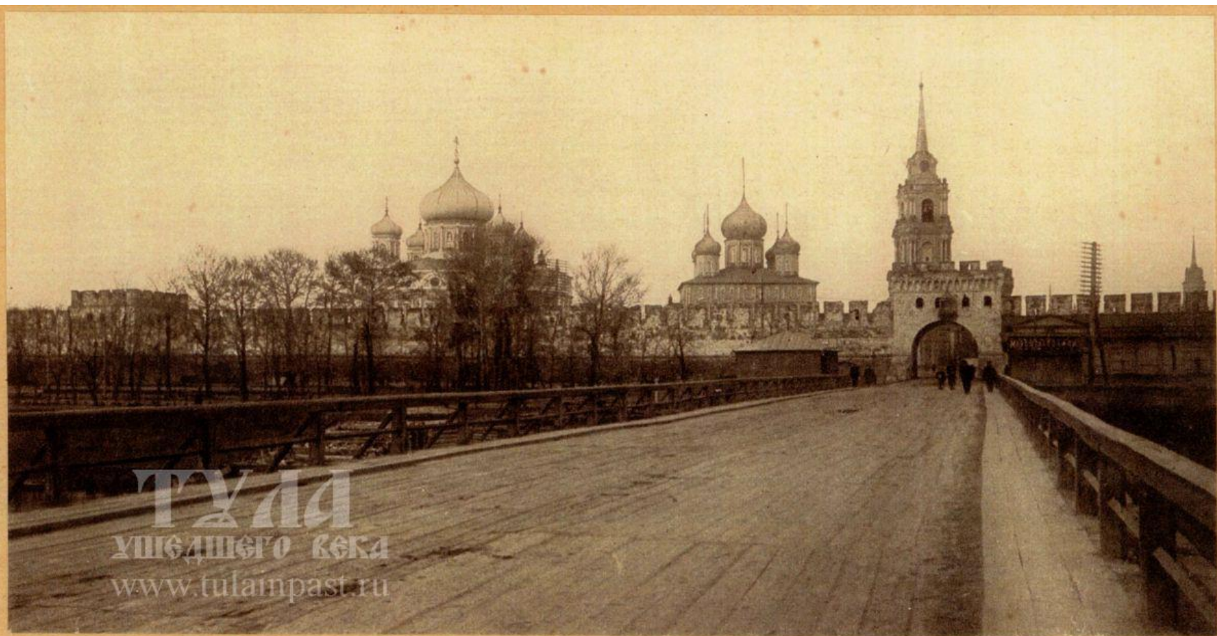
Фото-тинто-гравюра Т-ва „Образование“

Тула. Стѣны кремля (1514-1521 г. г.) и кремлевскіе соборы.