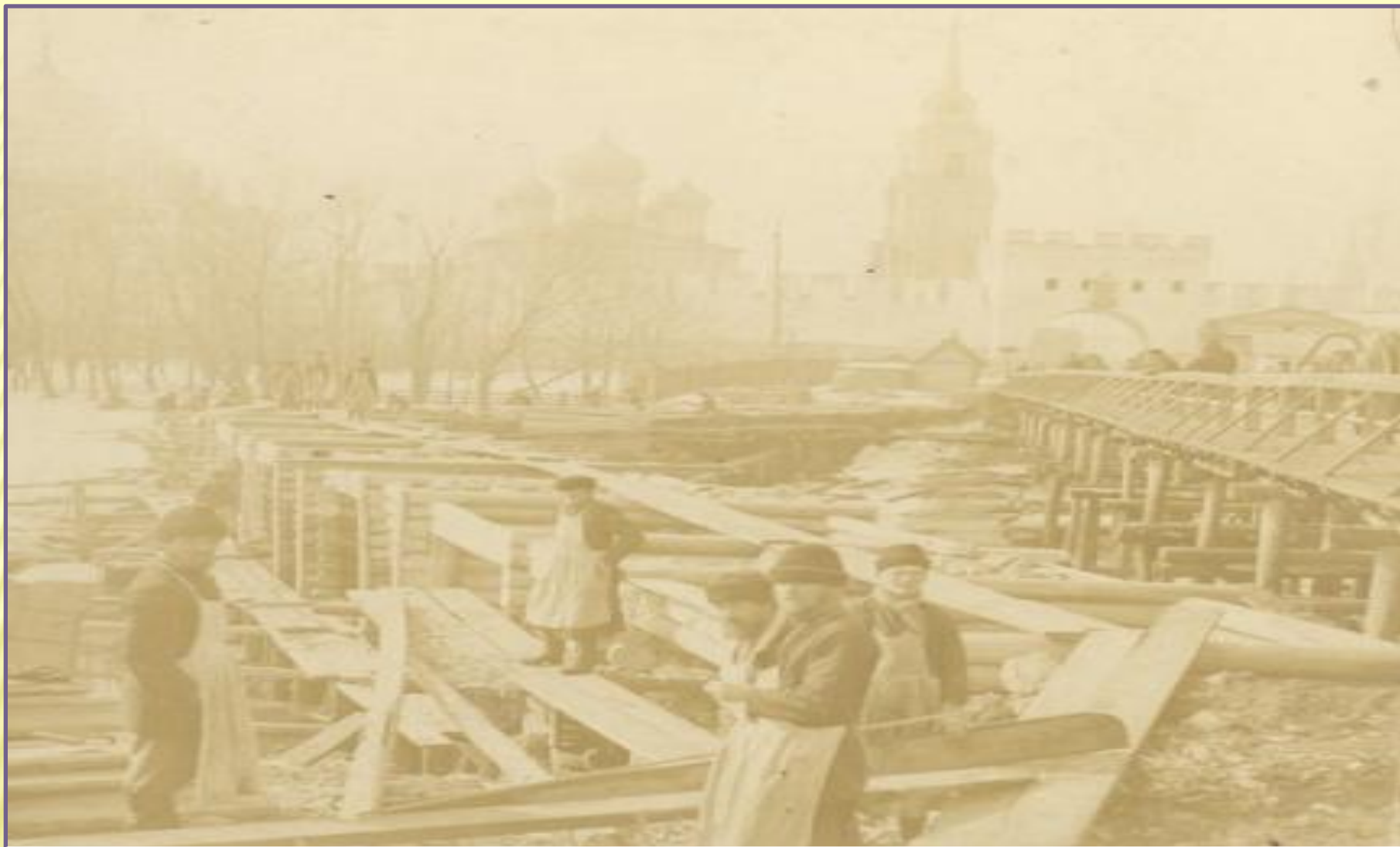
Рабочие тульского оружейного завода ремонтируют Кривой мост