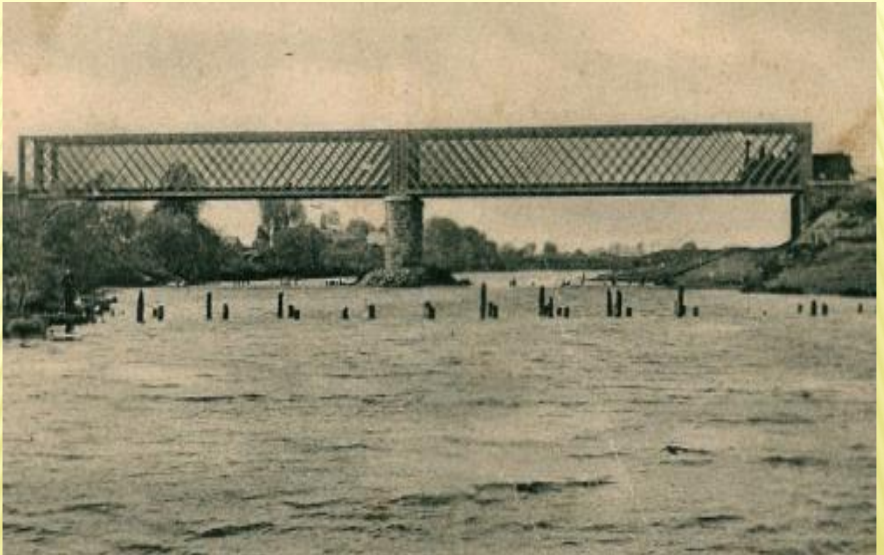
Старый железнодорожный мост через Упу