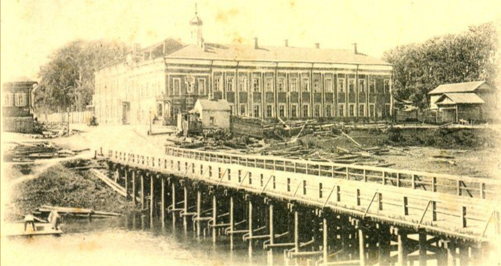
ВАСИЛЬКОВСКІЙ МОСТЪ, ТУЛА.

Васильевский мост 1863 г. Фото еще одного Чулковского моста не сохранилось.