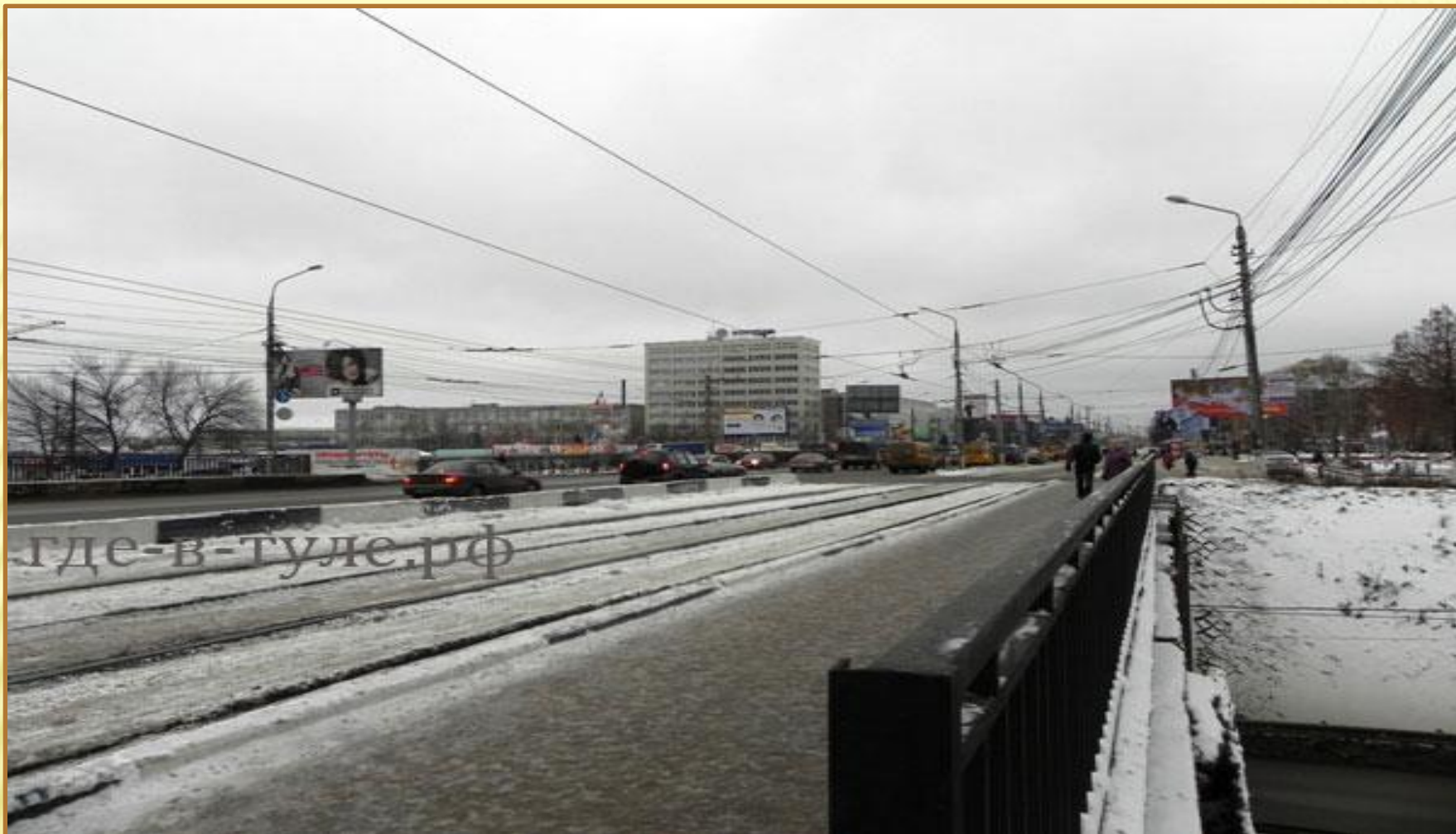
Мост Рязанский путепровод Мост на пересечении проспекта Ленина и улицы Рязанская в городе Туле