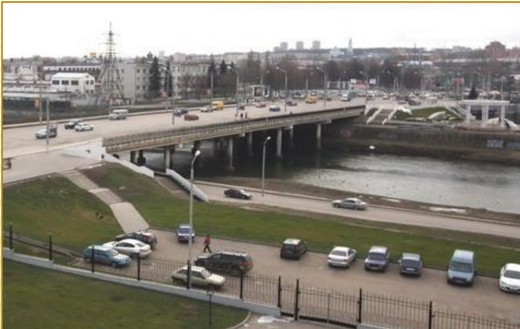
Мост через реку Упу, соединяющий Зареченский район с Советским