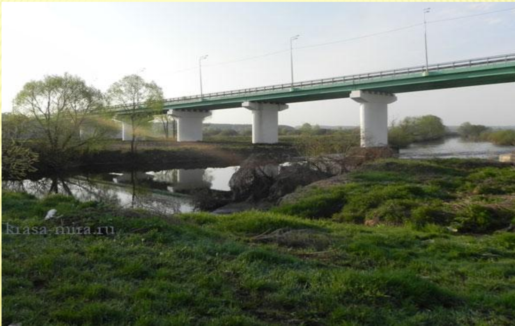
Мост через Упу