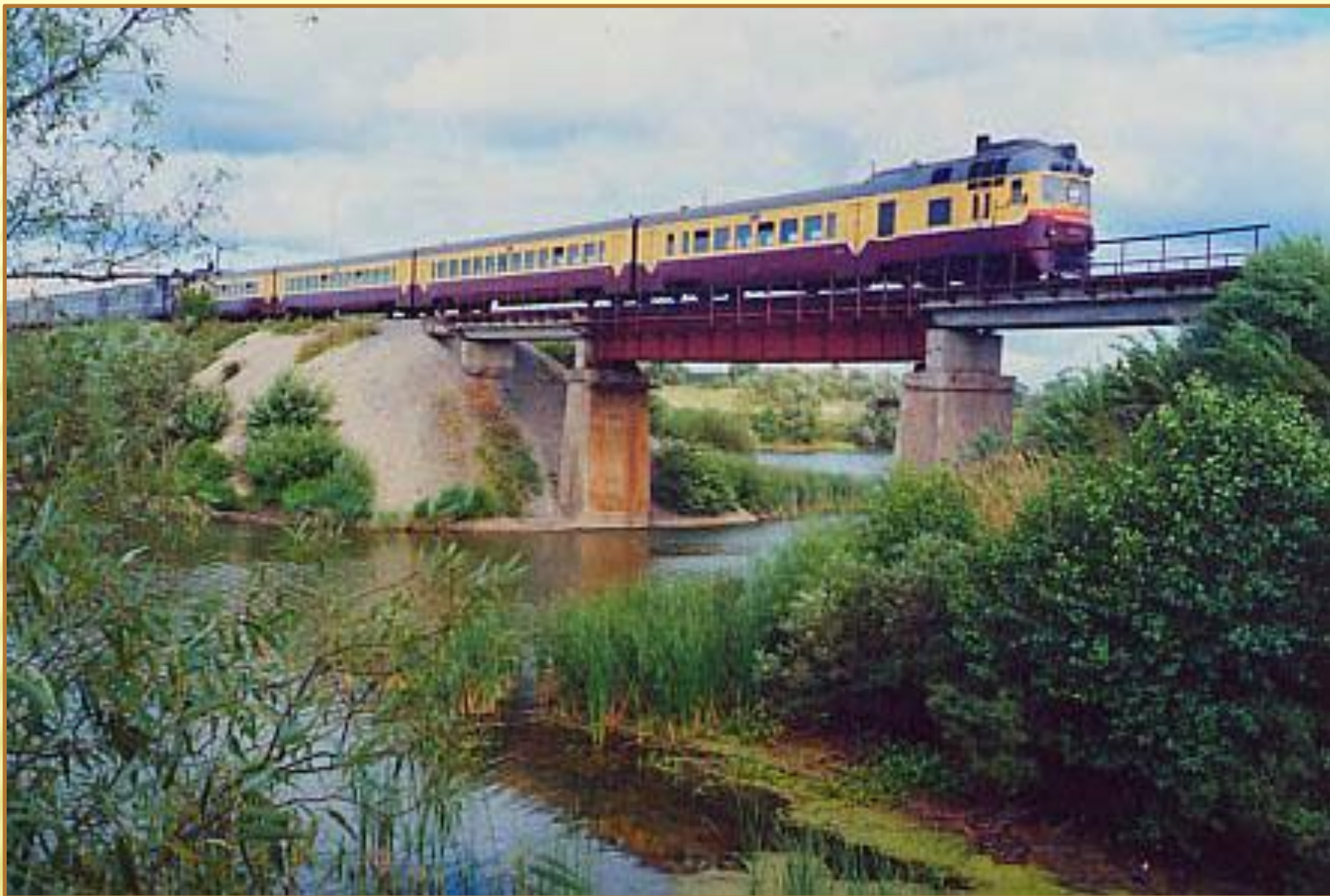
Железнодорожный через реку Оку