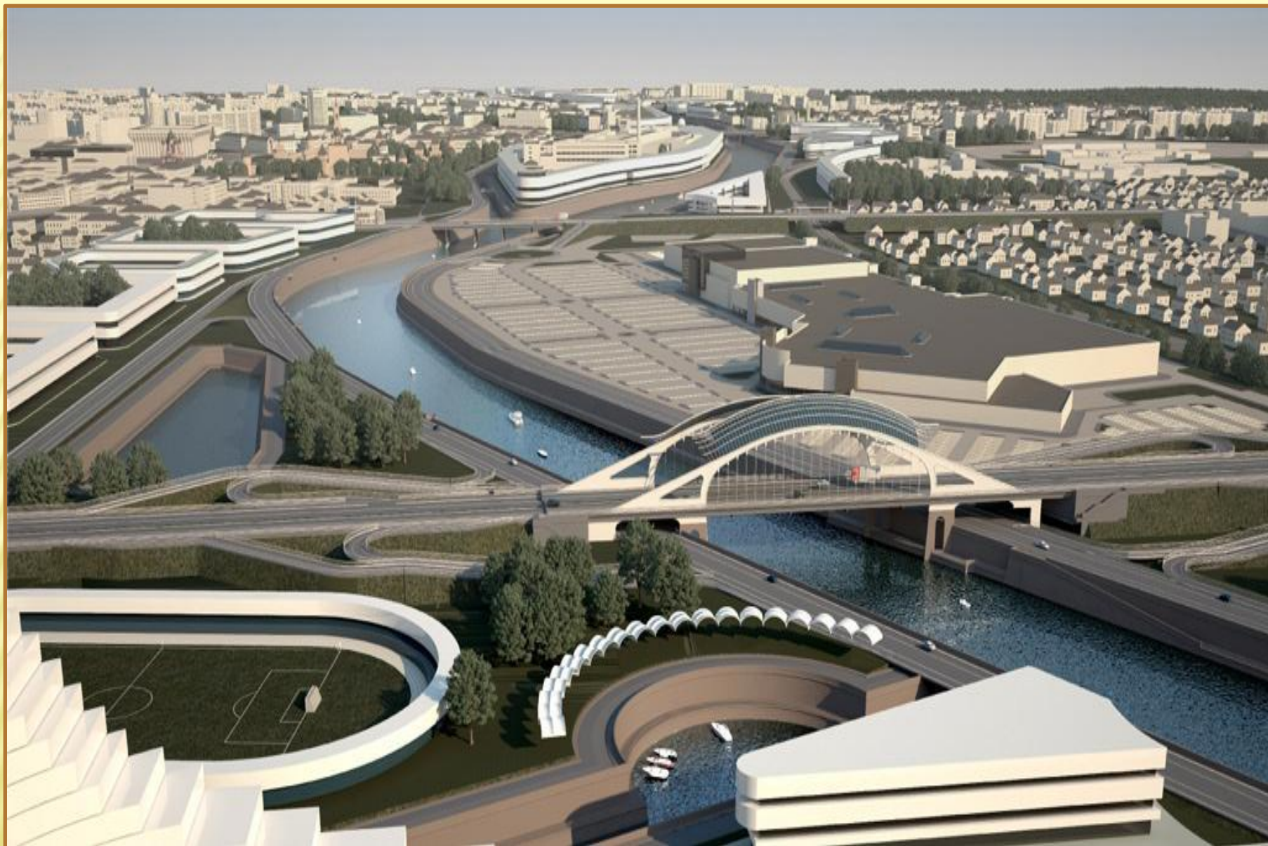
Проект набережной реки Уфы с тремя мостами