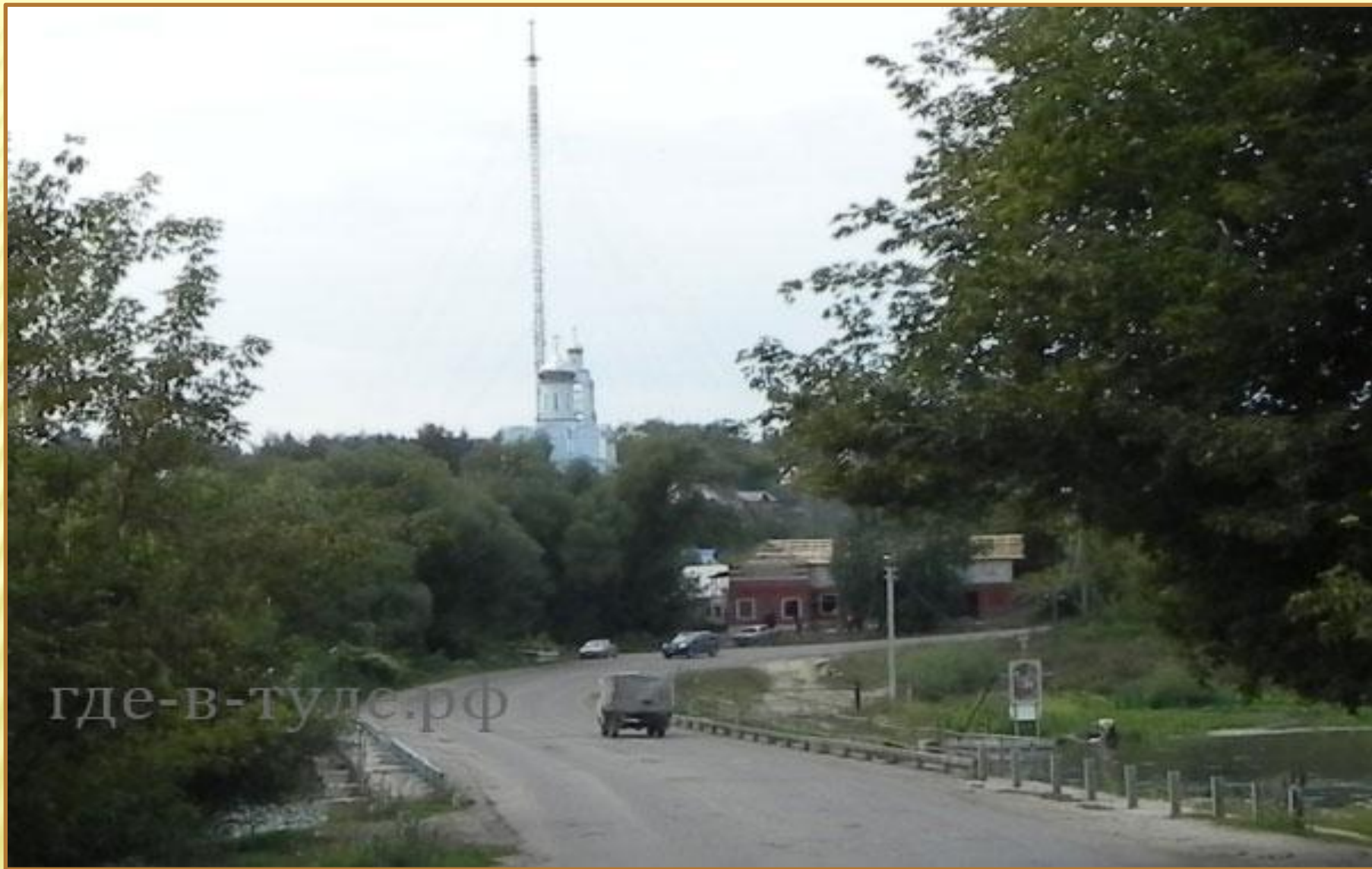
г.Ефремов мост через реку Красная Меча