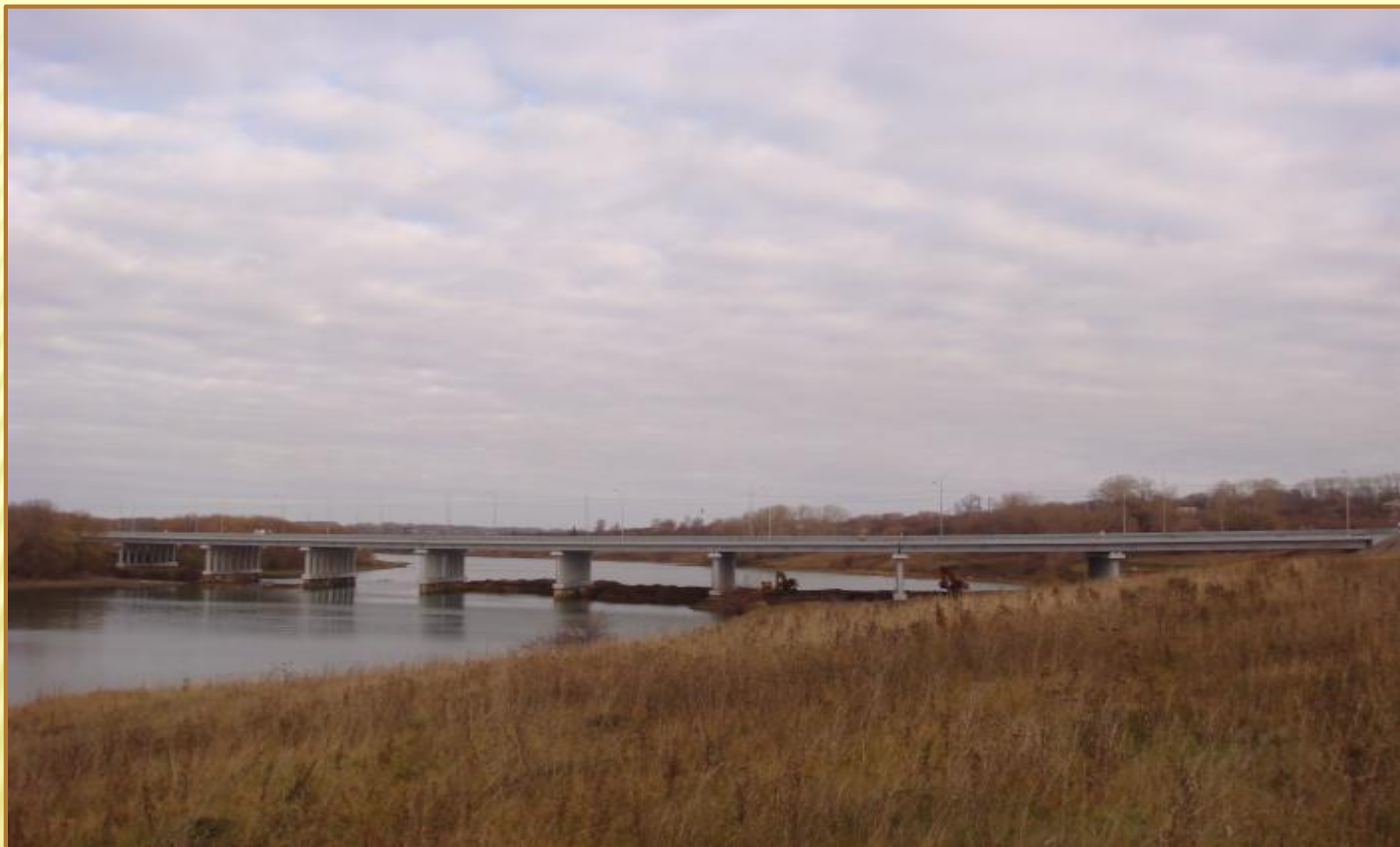
Мост через Любовское водохранилище в Тульской области