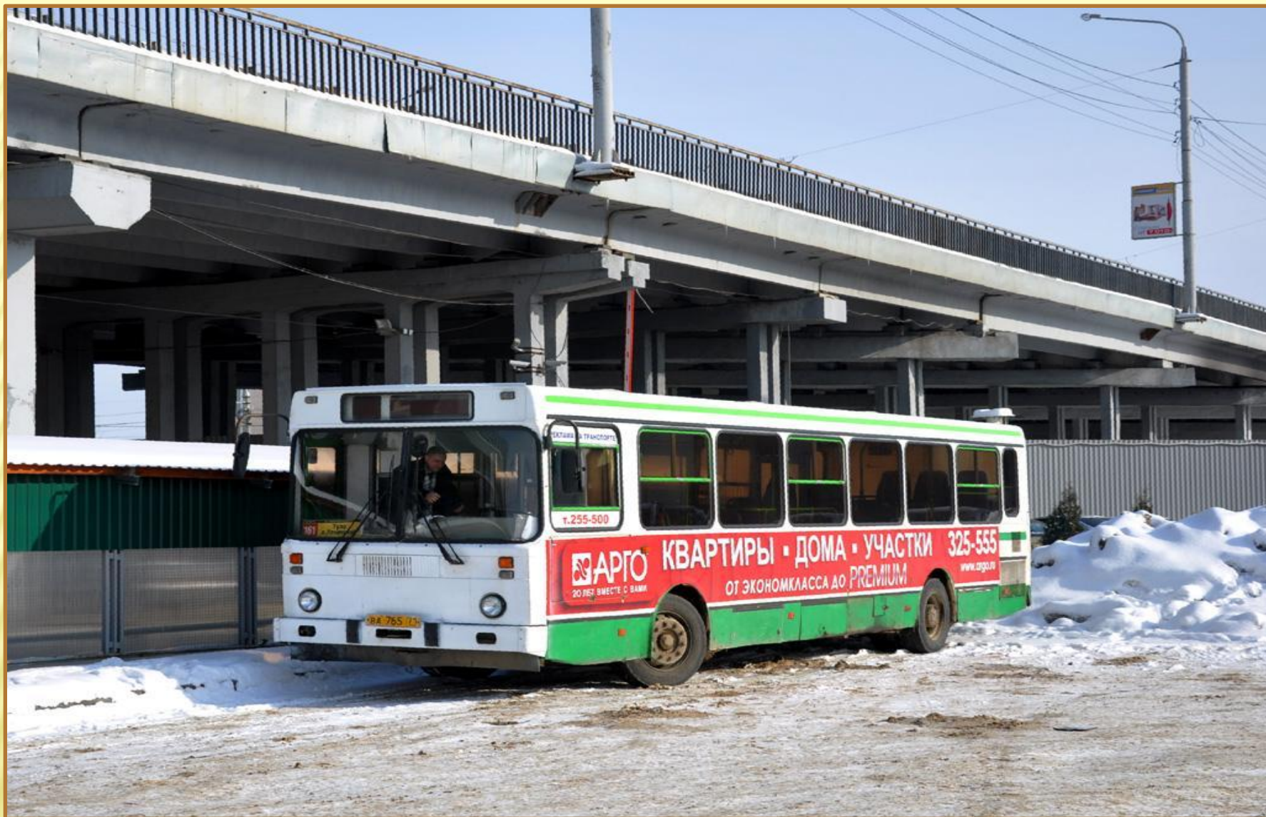
Демидовский мост в Заречье