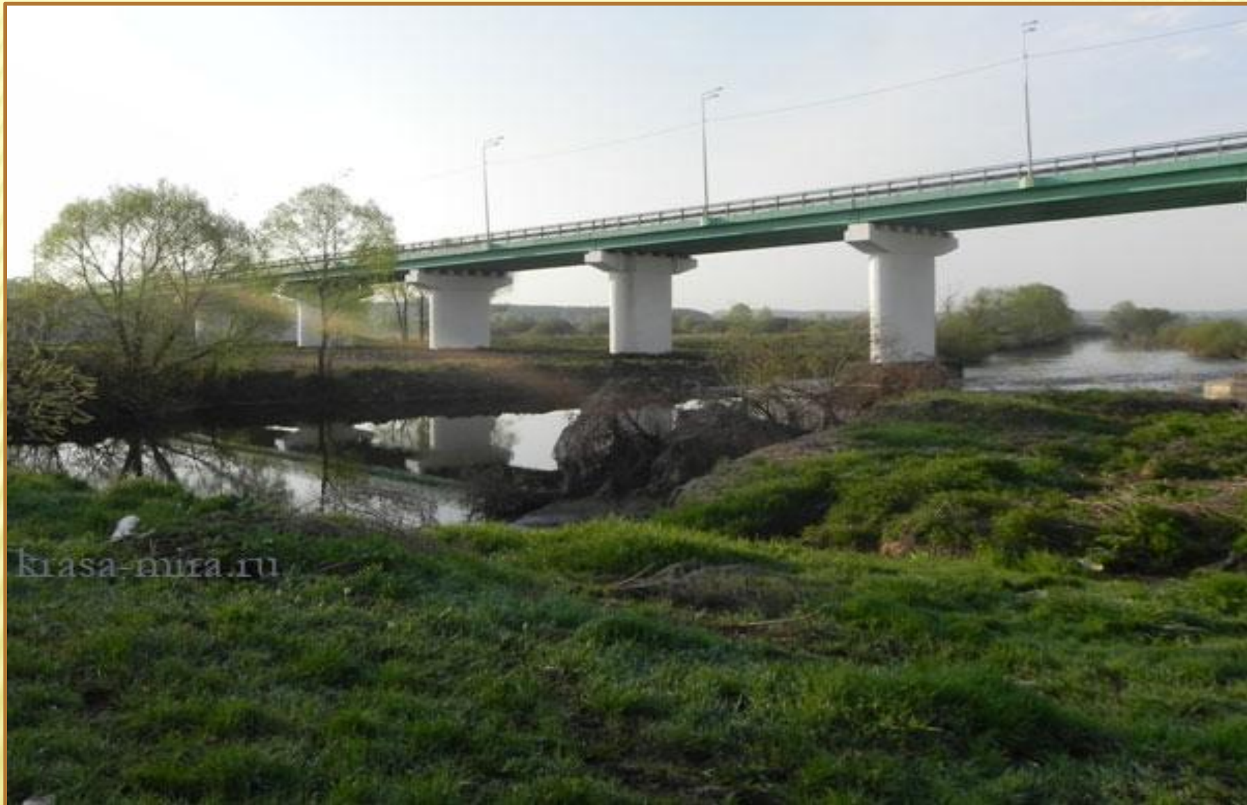
Мост через реку Упу