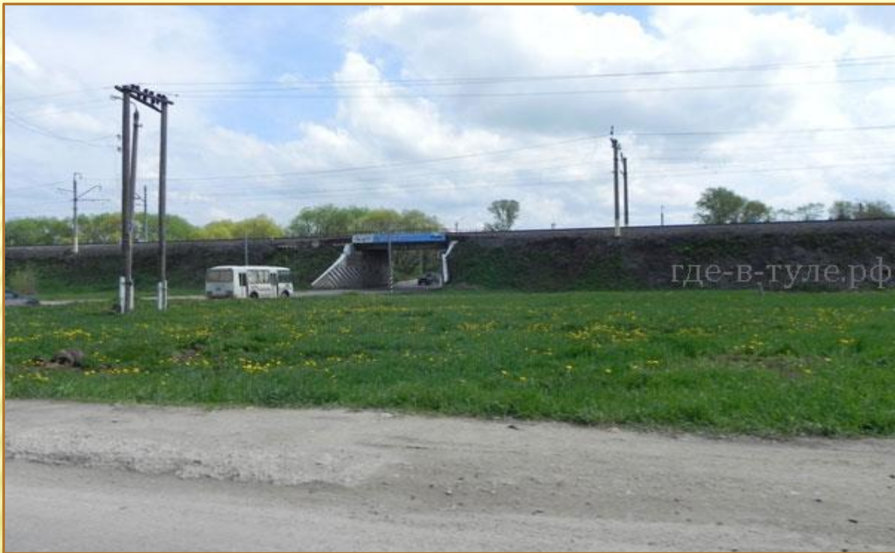
Мост над путепроводом при въезде в город Щекино