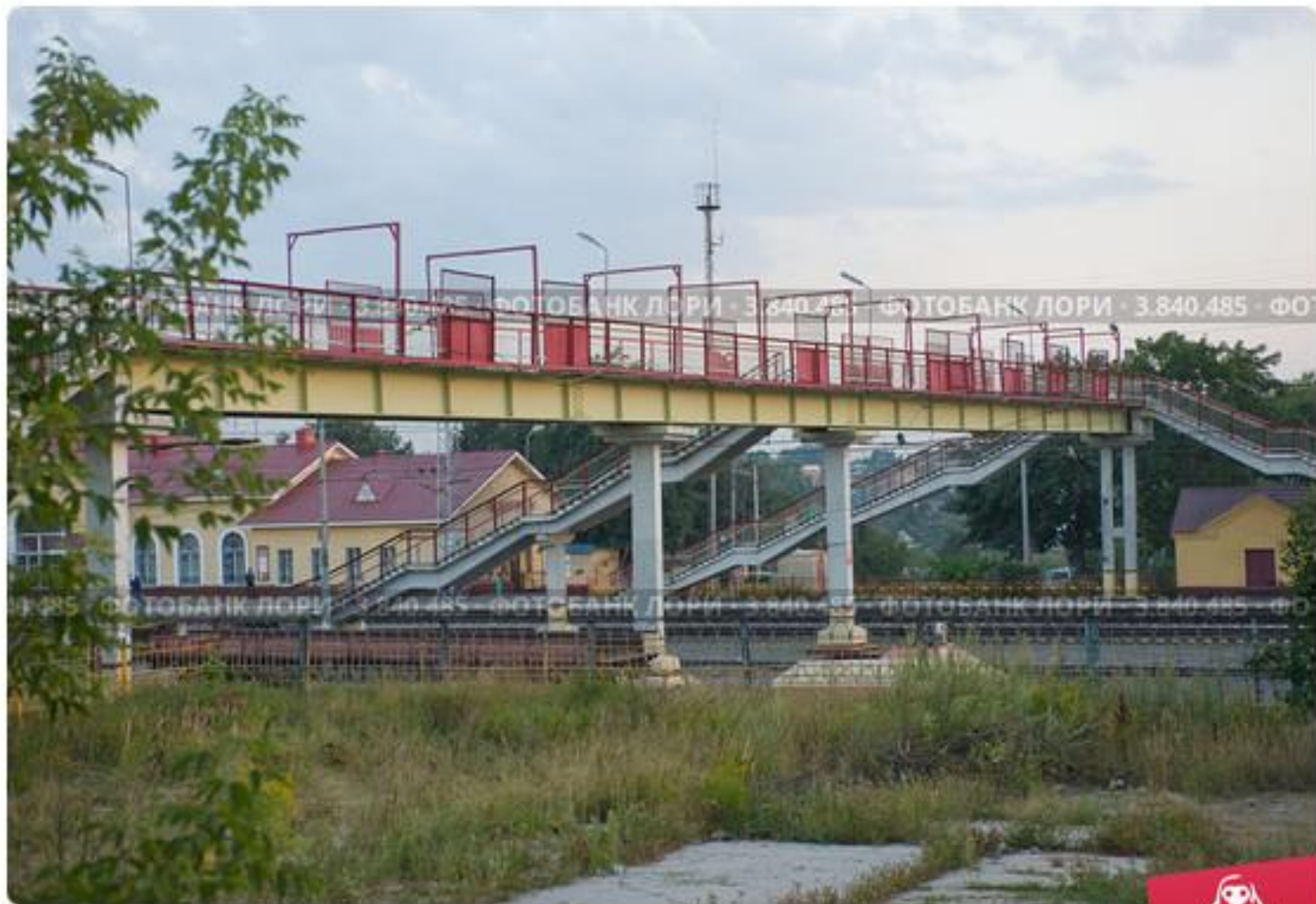
Железнодорожный пешеходный мост в городе Ясногорске Тульской области