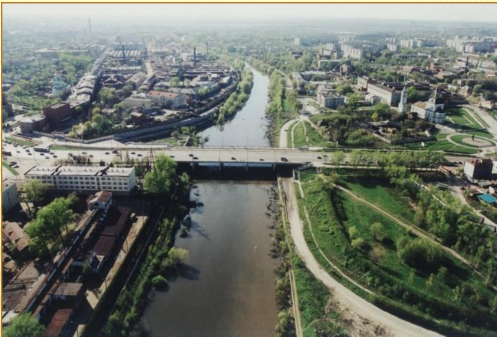
Тула с воздуха