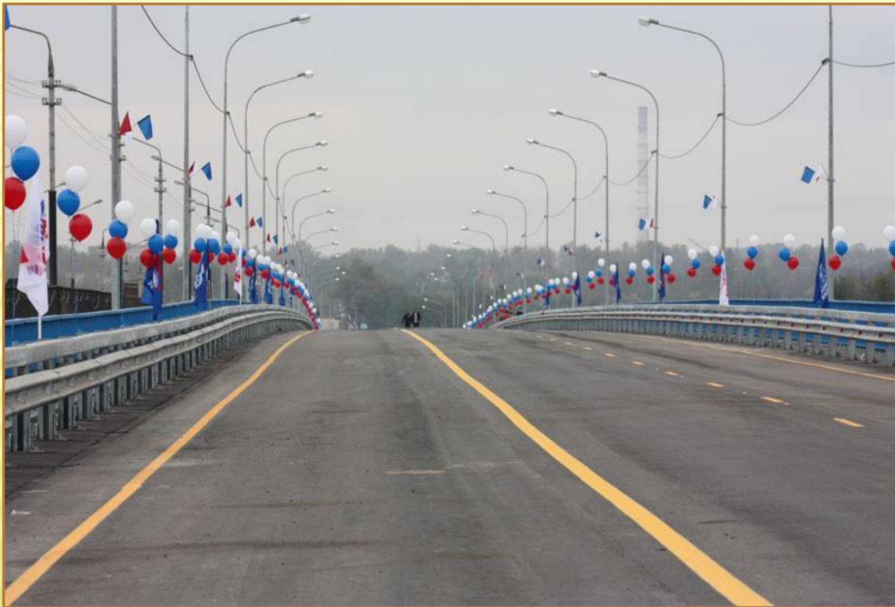
Новый мост в городе Алексине