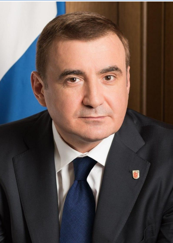
Дюмин Алексей Геннадьевич

провели тактико-специальные учения, в ходе которых были отработаны действия по переброске одного из подразделений ССО военно-транспортной и армейской авиацией, десантированию групп и груза ССО в район назначения.