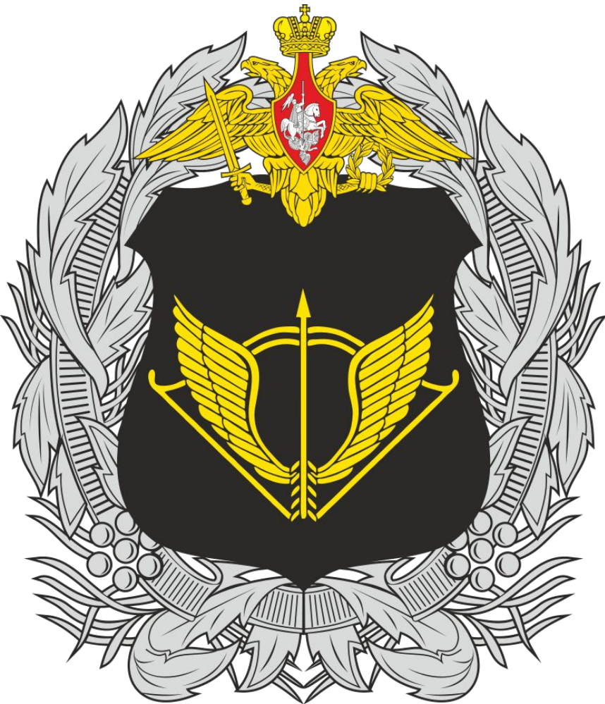
Большая эмблема Сил специальных операций России

Силы специальных операций Вооружённых сил Российской Федерации — структурное подразделение Вооружённых сил Российской Федерации, формирование которого началось в 2009 году в ходе масштабной реформы Вооружённых сил Российской Федерации (2008—2020). Сокращённо — ССО ВС России .