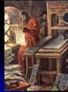
Первая печатная книга «Апостол»

Первую книгу печатали целый год. Это была священная книга «Апостол». Позже Иван Фёдоров напечатал для детей первую славянскую «Азбуку»