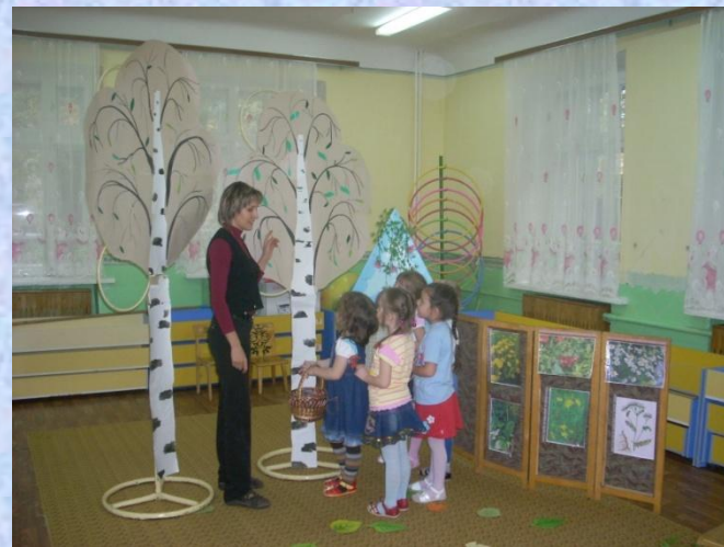
смотр открытых занятий на методических объединениях района