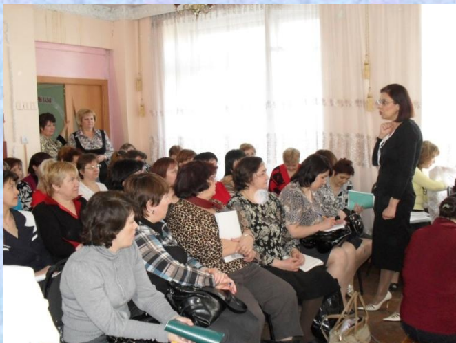
смотр мастер- класса для педагогов ДОУ в рамках курсов ИКТ