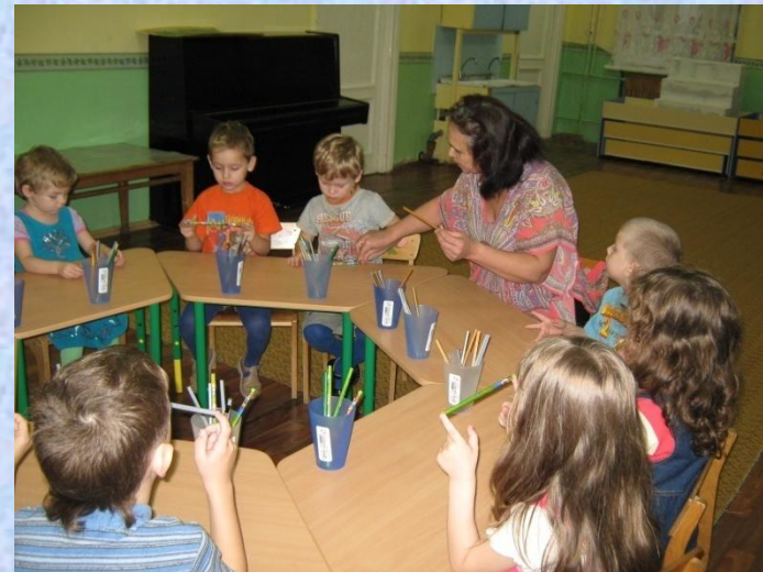
обобщение опыта работы на городском и республиканском уровне