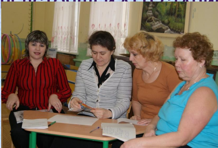
ознакомление с планом работы по аттестации