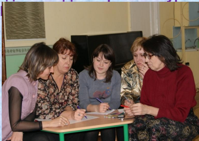
подготовка к компьютерному тестированию педагогов