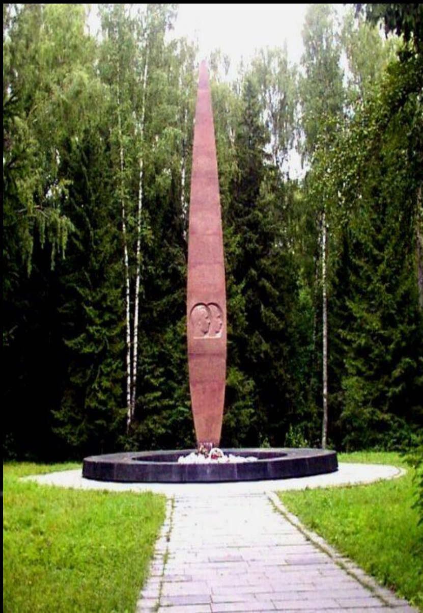
Обелиск на месте гибели лётчиков