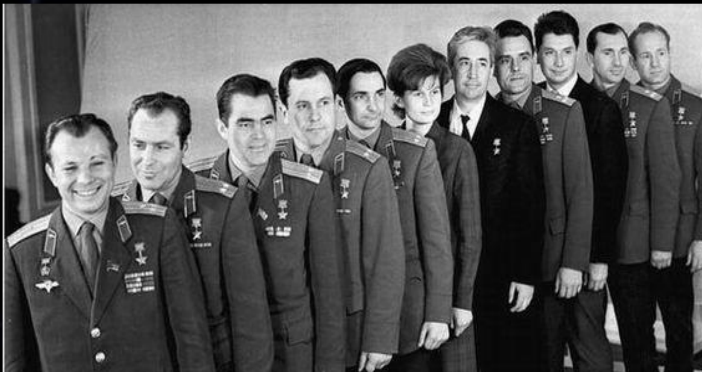
Отряд первых космонавтов

С 25 марта начались регулярные занятия по программе подготовки космонавтов.