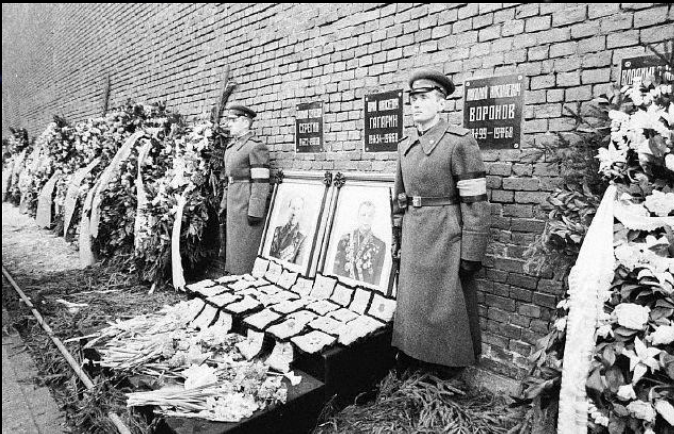
Похоронен Юрий Гагарин у Кремлёвской стены на Красной площади.