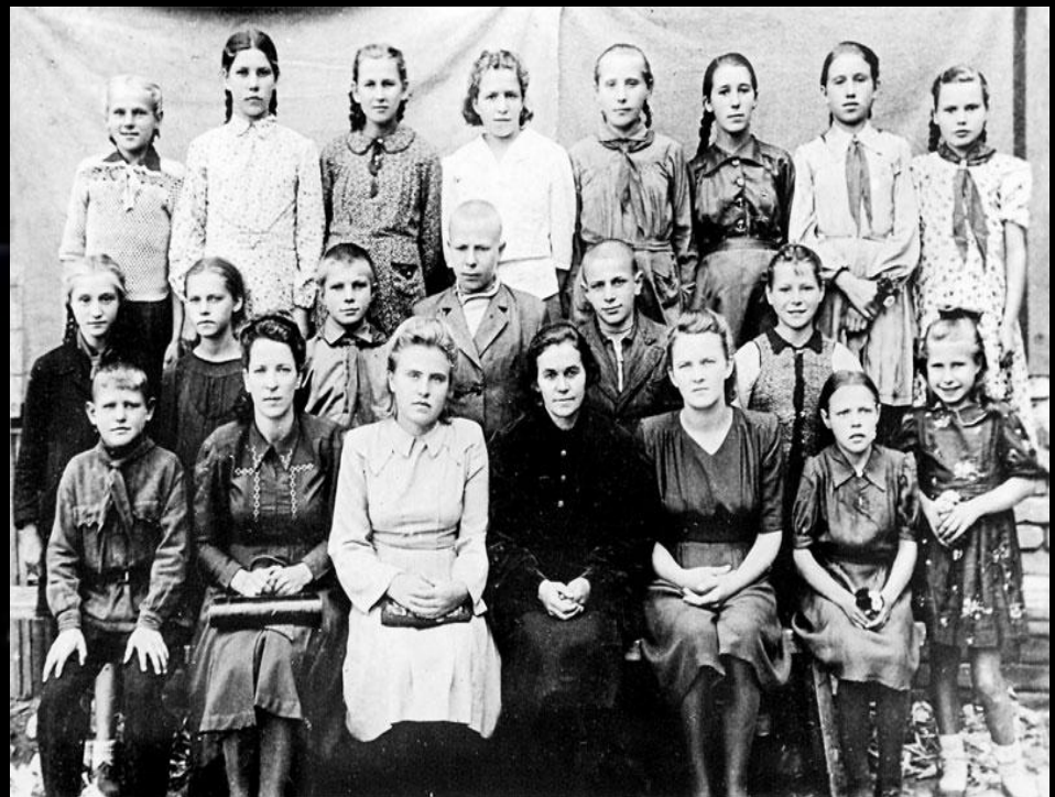
Одноклассники Юрия Гагарина