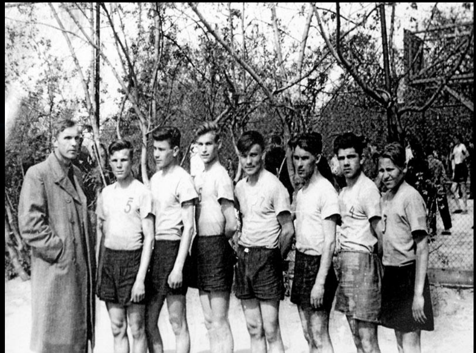
Юрий Гагарин – капитан баскетбольной команды Саратовского индустриально техникума