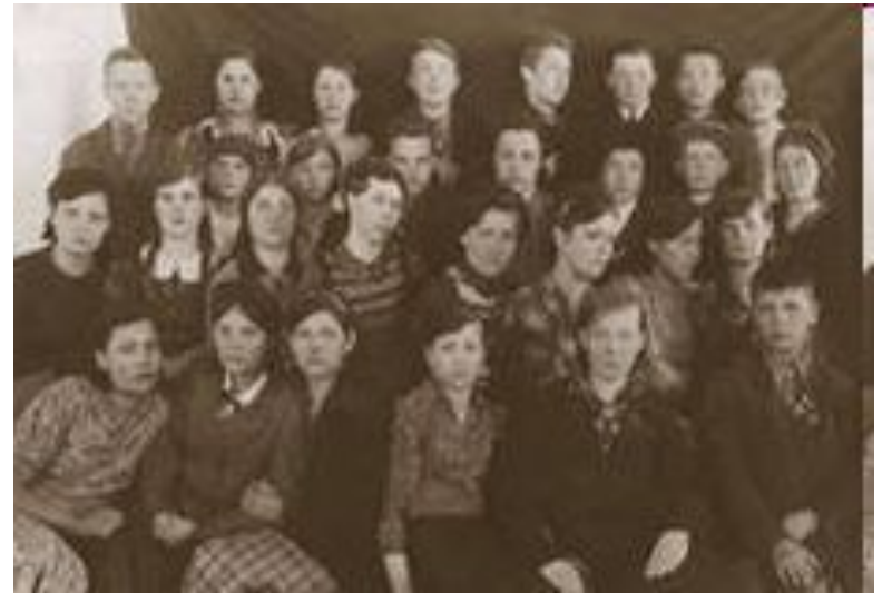
Туровская средняя школа. Выпуск 1941года. Все на фронт.

Со школьной скамьи уходили ребята на фронт. Те, кто сражался на фронте, отдавали все свои силы для достижения победы над врагом. Многие из них не вернулись. А дома оставались только женщины и дети.