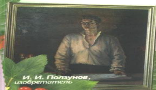
И. И. Ползунов, изобретатель