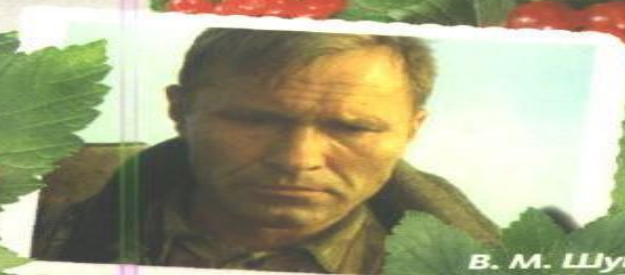
В. М. Шукшин, писатель, актер, режиссер