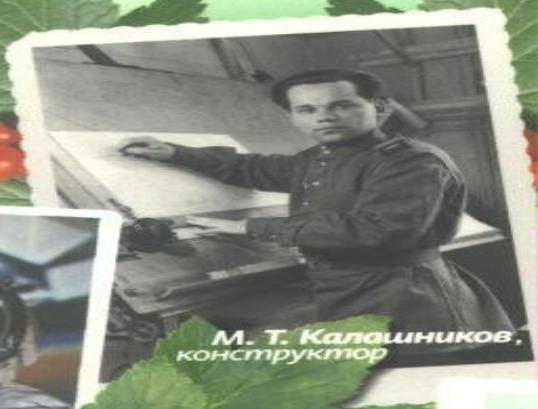
М. Т. Калашников, конструктор