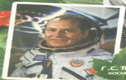
Г. С. Титов, космонавт