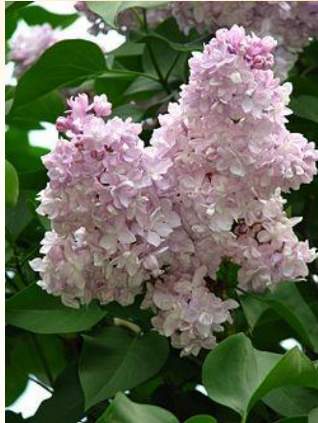
Сирень «Polina Osipenko»

Полина Денисовна Осипенко (в девичестве Дудник ; (1907—1939) — советская летчица; одна из первых женщин, удостоенных звания Герой Советского Союза .