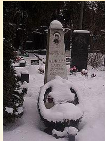
Могила М. П. Чечневой на Кунцевском кладбище Москвы.

«Девушка-сокол» ( 15 августа 1922 года — 12 января 1984 года ) — лётчица, Герой Советского Союза , во время Великой Отечественной войны командовала эскадрильей 46-го Таманского гвардейского ночного легкомбардировочного полка , гвардии майор .