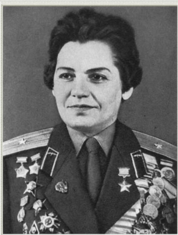
ЧЕЧНЕВА Марина Павловна

«Девушка-сокол» ( 15 августа 1922 года — 12 января 1984 года ) — лётчица, Герой Советского Союза , во время Великой Отечественной войны командовала эскадрильей 46-го Таманского гвардейского ночного легкомбардировочного полка , гвардии майор .