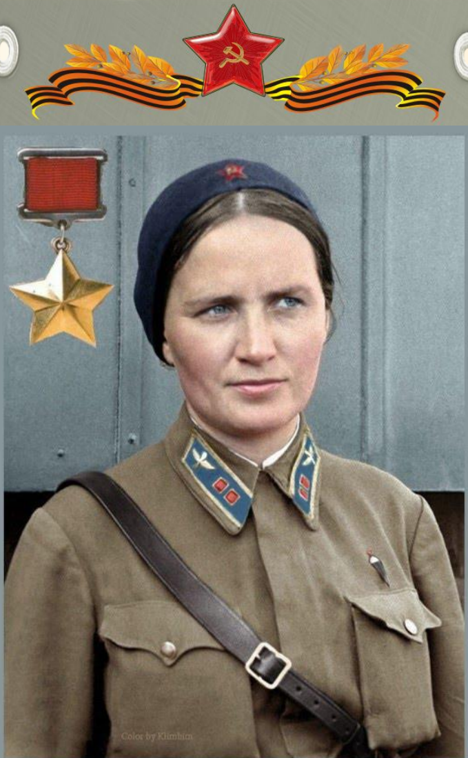
Марина Михайловна Раскова

Марина Михайловна Раскова (в девичестве Малинина; 15 28 марта 1912 года, Москва — 4 января 1943, Саратовская область ) — советская лётчица-штурман, майор Военно-Воздушных Сил РККА , одна из первых женщин, удостоенная звания Герой Советского Союза (1938).