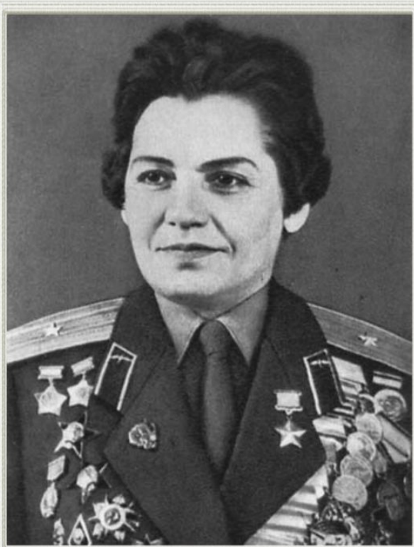
ЧЕЧНЕВА Марина Павловна

«Девушка-сокол» ( 15 августа 1922 года — 12 января 1984 года ) — лётчица, Герой Советского Союза , во время Великой Отечественной войны командовала эскадрильей 46-го Таманского гвардейского ночного легкомбардировочного полка , гвардии майор .