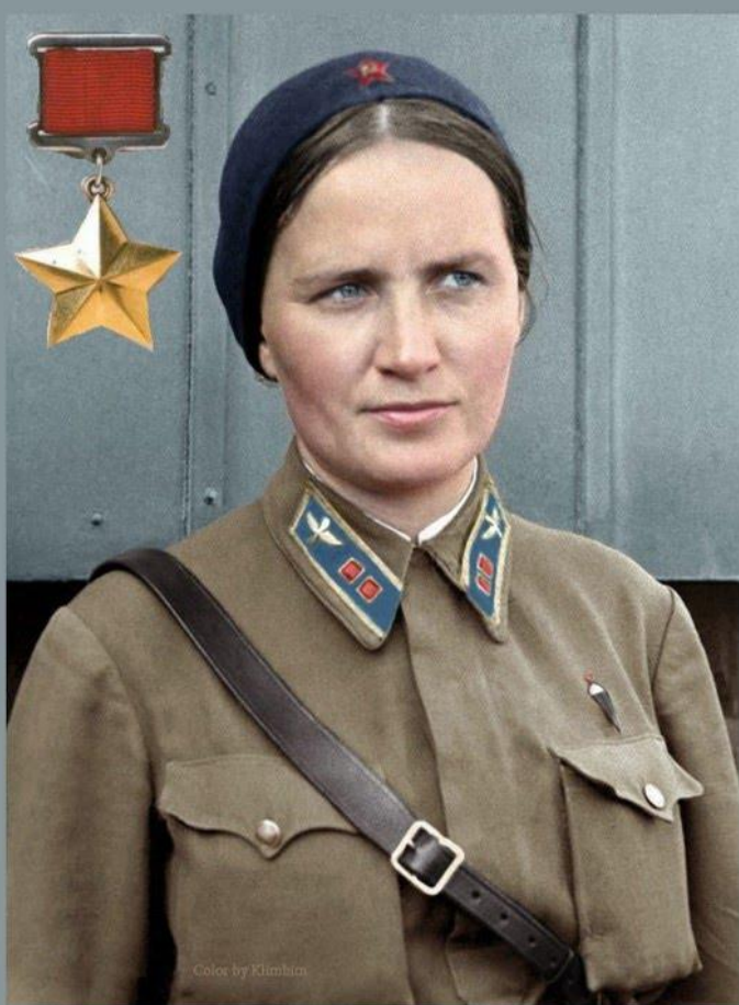
Марина Михайловна Раскова