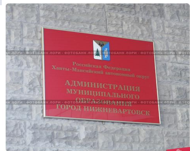
Нижневартовск. Табличка городской администрации