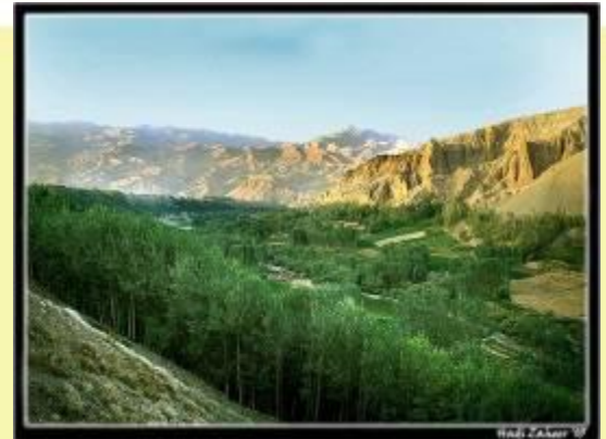
Hadji Zaher '99