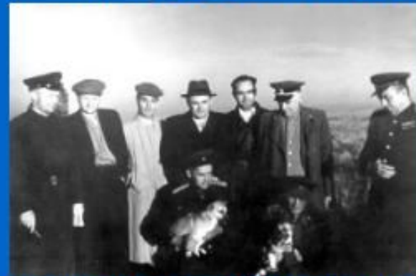
Собаки-космонавты: Звездочка, Чернушка, Стрелка и Белка (фото 1961 г.).