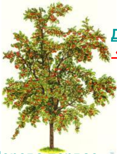
Дерево первое «Где спряталось добро»

Иди, мой друг, иди всегда дорогою добра!