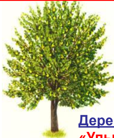
Дерево третье «Улыбка доброты»