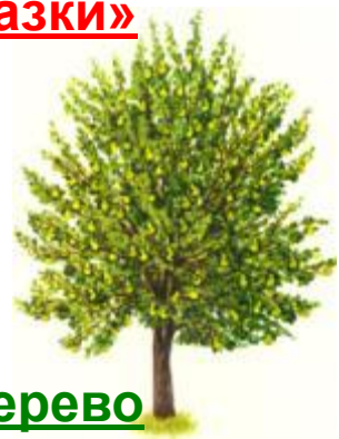
Дерево седьмое «Добрые слова»