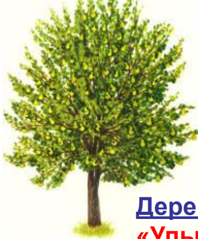
Дерево третье «Улыбка доброты»