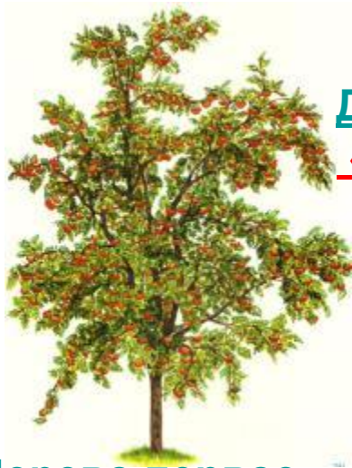
Дерево первое «Где спряталось добро»

Пусть эти слова будут девизом на всю вашу жизнь!