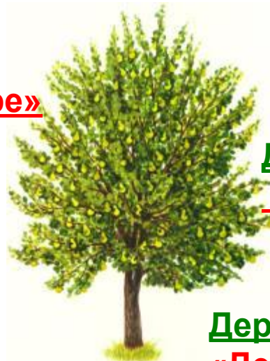
Дерево четвертое «Добрые сказки»