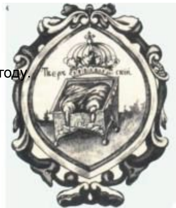
Герб Тверской Губернии в 1672 году.