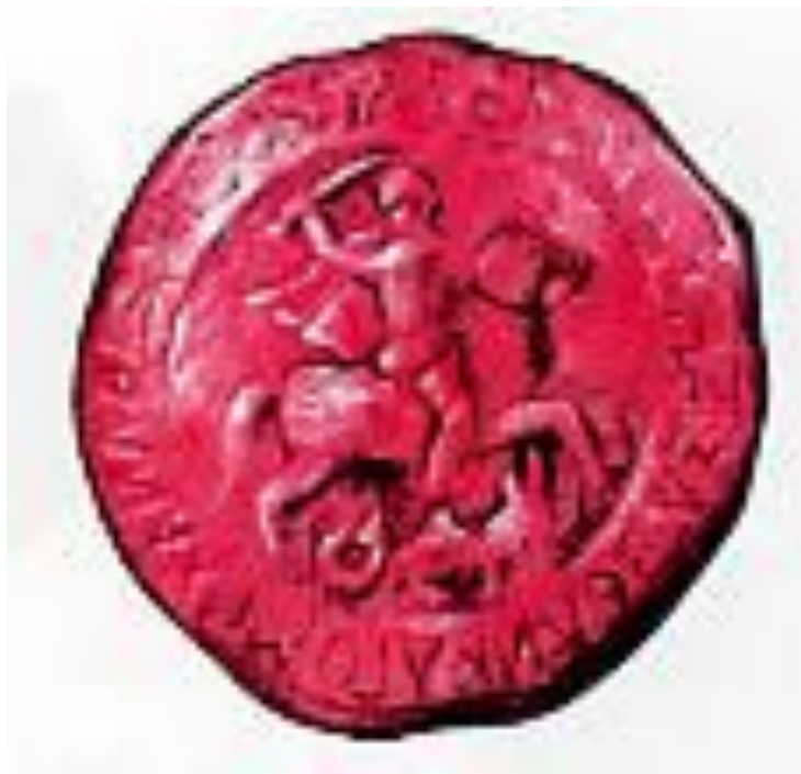
Герб Твери в 15 веке