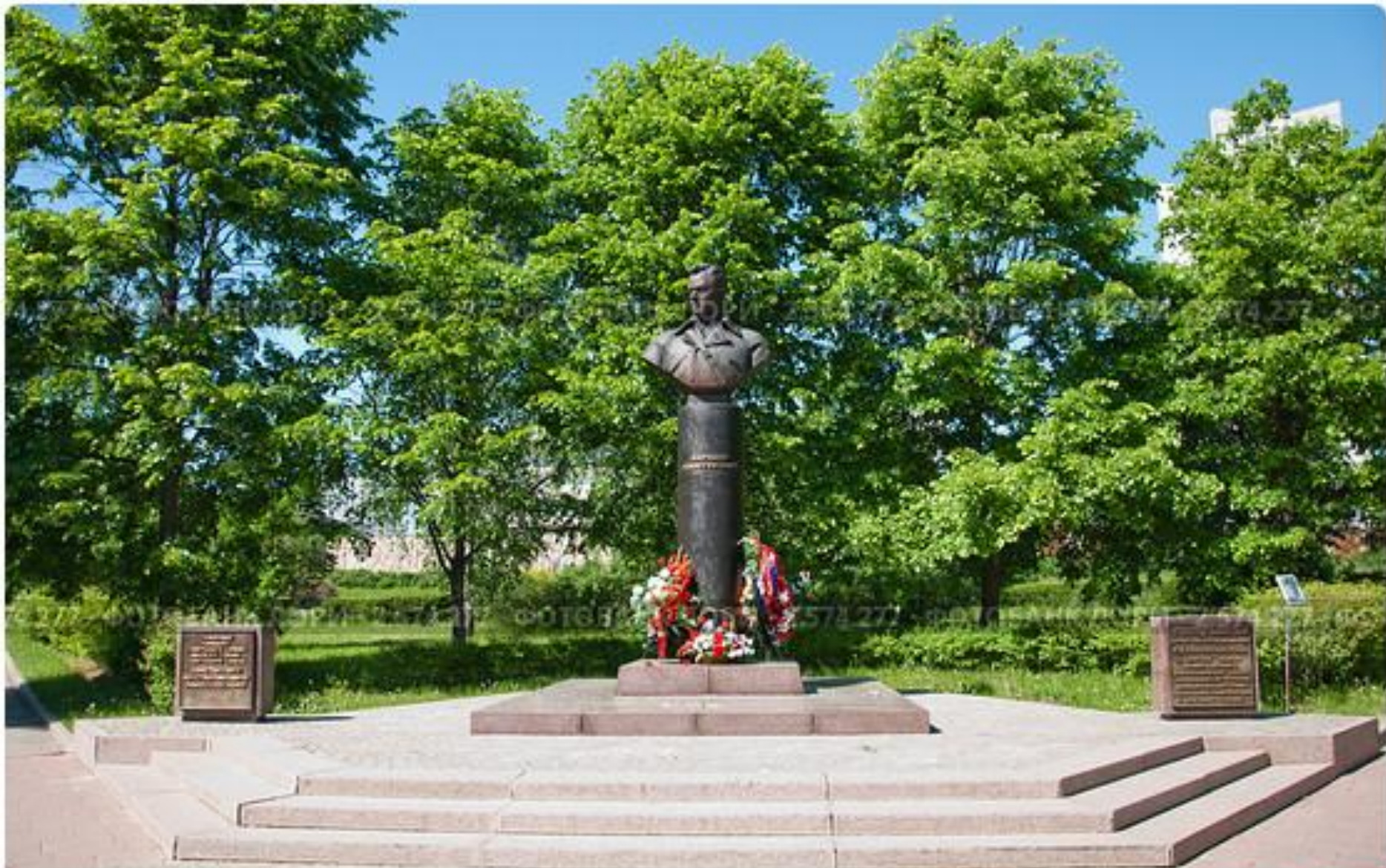
В Парке им. 40-летия Победы, около здания Префектуры, стоит памятник-бюст Маршалу Советского Союза К.К. Рокоссовскому. Установлен в 2003 году