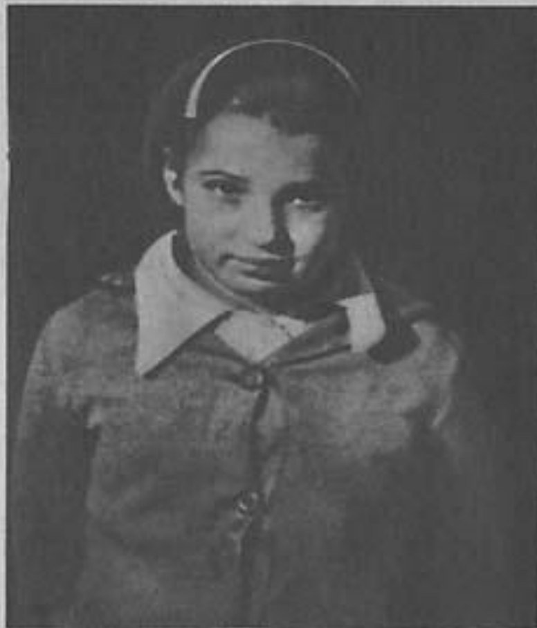
Таня Савичева. Фрагмент группового снимка