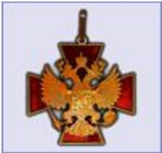
орден "За заслуги перед Отечеством"

Пожарное дело- для крепких парней, Пожарное дело- спасение людей, Пожарное дело-отвага и честь, Пожарное дело- так было и есть!