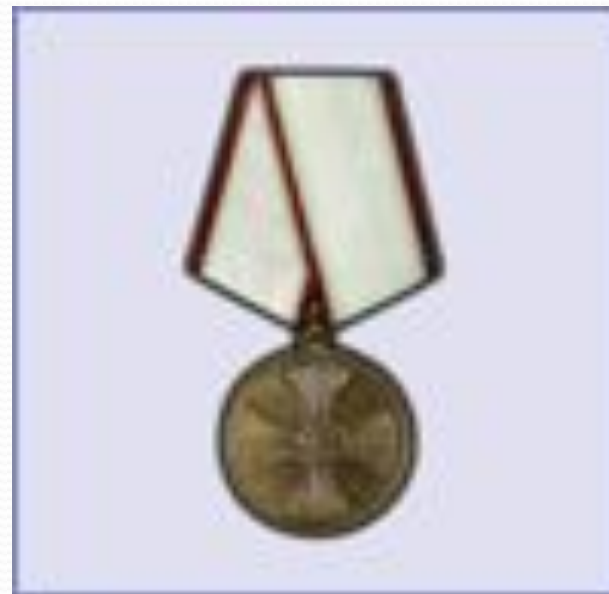
Медаль «За спасение погибших»