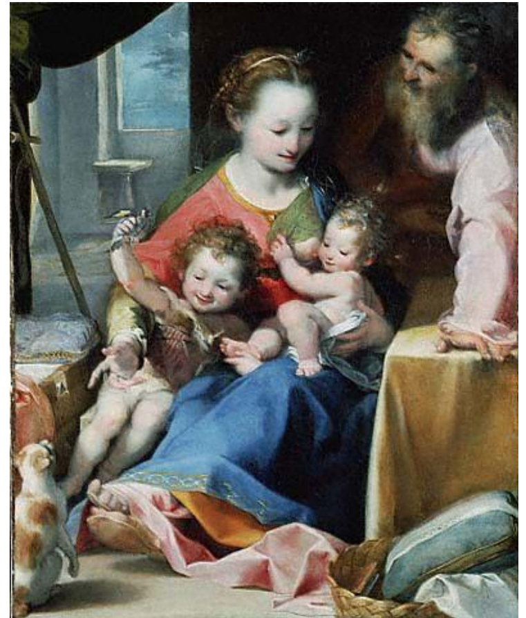
Рембрант «Мадонна с младенцем и Св. Иосифом»