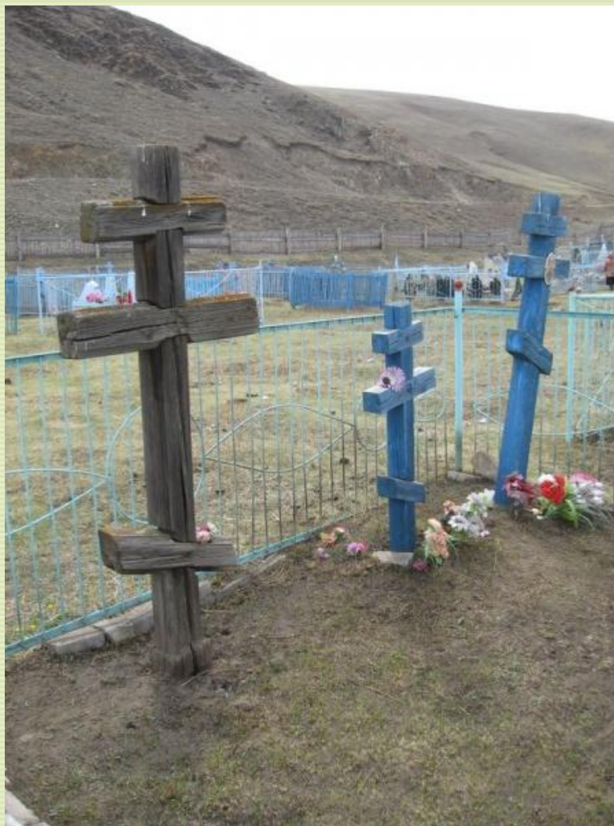
Могильные кресты староверов (Бичура)